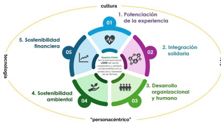
Ilustración 1- Brújula Estratégica