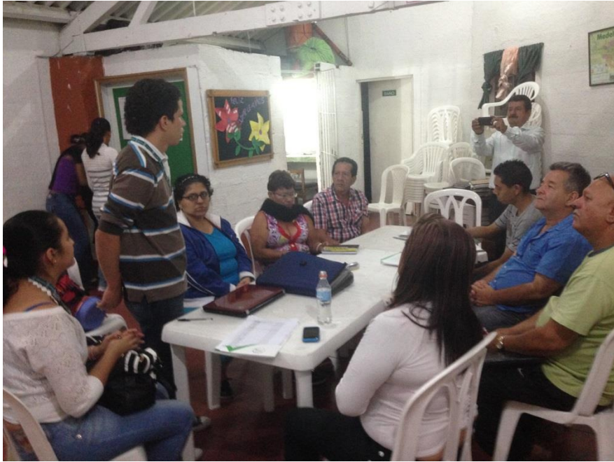
Reunión JAC Villa la Candelaria socializando el alcance del proyecto de grado, tomada el 6 de mayo de 2014.