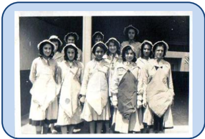
1937 Colegio Privado: PARDO VERGARA