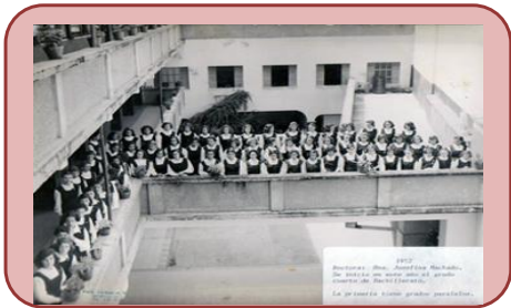
1945 Colegio EL CARMELO