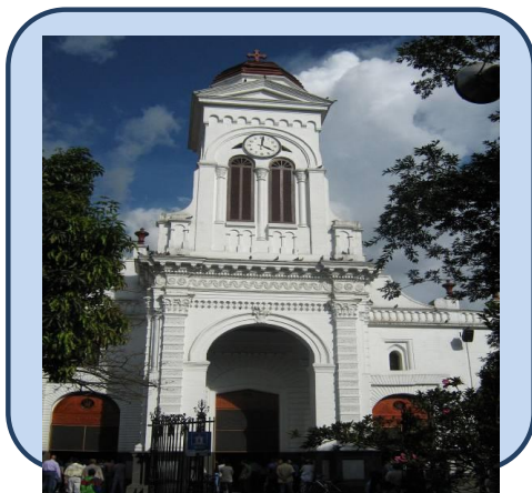
Iglesia de Santa Ana