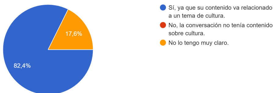
Gráfico 1. Conversaciones de carácter cultural