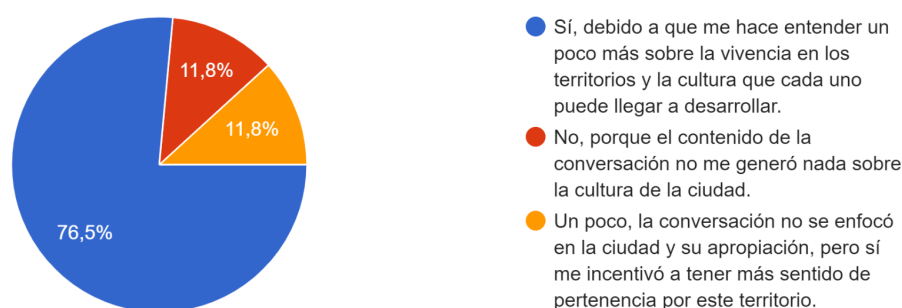
Gráfico 2. Conversaciones con apropiación de identidad territorial