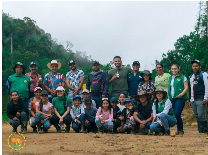
Figura No. 2 Fomento del sentido de pertenencia

aportando también la construcción de propuestas para el mejoramiento de los procesos en conjunto. Esto ha contribuido a que una parte de los sujetos se apropien de este tema de la asociatividad, asistan a las reuniones, capacitaciones etc. y mitigar el imaginario de que solo el gerente, junta directiva y el área administrativa tienen el dominio total de las decisiones relacionadas a ASPROQUEMA.