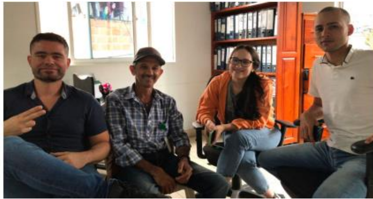
Figura No. 4 Charlas con junta directiva

En lo que se refiere al tema de proyectos, la cual es una de las principales fuentes de financiación de estas organizaciones productivas, también se retomó dentro de estas charlas la necesidad de formular proyectos que beneficiarán a mujeres y perfilar a ASPROQUEMA como una plataforma de equidad de género en el sector rural, es por ello que con el Centro de Tecnología de Antioquia se postuló uno con este enfoque, presentando como idea principal que a través de elementos tecnológicos e innovadores se pudiera hacer más eficaz el procedimiento de preparación del queso de banco en las fincas, con el fin de que para las mujeres fuese más práctico y no invirtieran tanto tiempo en la realización de esta tarea y así poder usar dicho tiempo en otras actividades, como espacios de ocio y actividades de interés para ellas