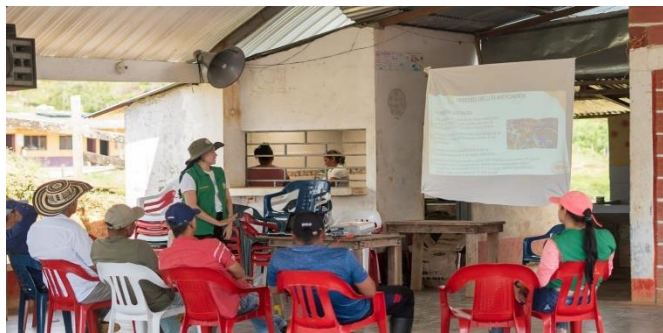
Figura No. 1 Visibilización de las acciones de responsabilidad social

dado que se ha visto el incremento de solicitudes de auxilios económicos por parte de las familias asociadas aproximadamente en un 40% y para el área administrativa ha sido más práctico la utilización de los formatos diseñados y el establecimiento de requisitos claros para acceder al beneficio. Además, dentro de los espacios de socialización llevados a cabo en los núcleos veredales se escucharon muchas propuestas por parte de asociados para mejorar los servicios ofrecidos por la organización, propuestas que han sido tomados en cuenta para optimizar estas acciones, todo ello se ha considerado como una manera de mejorar la relación entre asociado y organización.