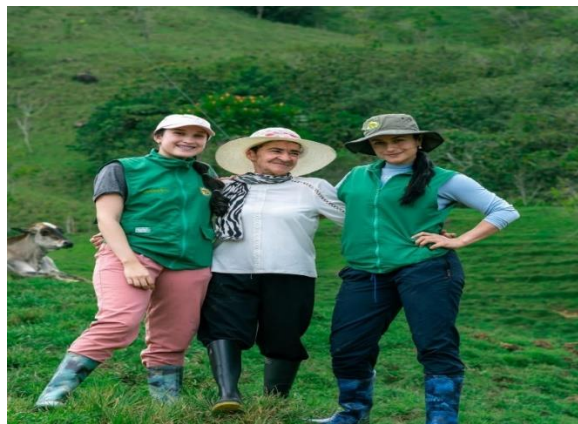
Figura No. 3 Visibilización de la mujer rural

A través de esta acción de concientización y sensibilización se obtuvo muy buena respuesta en las redes sociales y posibilitó llevar a la reflexión y cuestionamiento de los estereotipos de género que siempre han permanecido en la sociedad, además de los desafíos y necesidades por los que atraviesan las mujeres rurales. Por otro lado, esta estrategia se convirtió en una oportunidad para brindarle a las mujeres que participaron una plataforma para compartir sus perspectivas respecto a estos temas, y proporcionarles de uno u otro modo reconocimiento desde la asociación, generando un sentir de valoración y apreciación de la organización hacia ellas por sus aportes al desarrollo social.