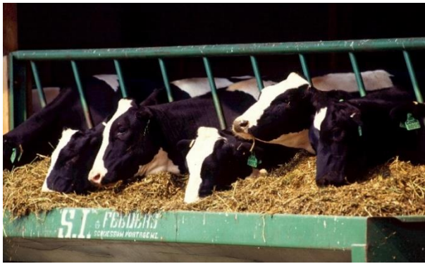
Figura 3. Ganado bovino. (2017, 20 febrero). [Fotografía]. https://pxhere.com/