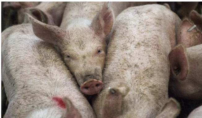
Figura 4. Ganado porcino. (2017, 10 marzo). [Fotografía]. https://pxhere.com/