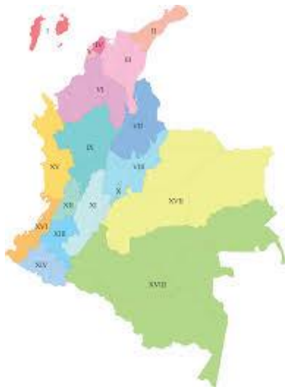
Figura 1. Mapa de Colombia. (2010, 15 octubre). [Fotografía]. https://pxhere.com/ .