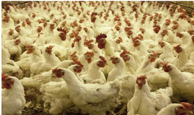
Figura 6. Ganado avícola. (2017, 26 mayo). [Fotografía].

Cada organismo vivo que habita en nuestro planeta tiene una función importante en su ecosistema, pretendemos resaltar la relevancia del Reino Animalia en la biosfera. ¿Podríamos sobrevivir sin ellos? La respuesta es un definitivo no, la vida humana estaría en grave peligro si algunas especies desaparecieran. Los animales son seres vivos esenciales para mantener el equilibrio ecológico perfecto. El Reino Animal conforma un grupo bastante heterogéneo donde también entramos los seres humanos.