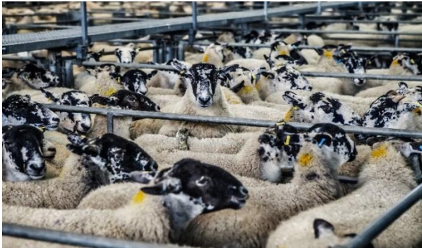
Figura 2. Ganado ovino. (2017, 19 enero). [Fotografía]. https://pxhere.com/