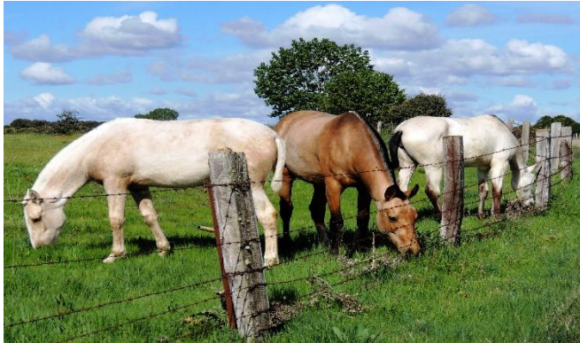
Figura 5. Ganado equino. (2017, 26 mayo). [Fotografía]. https://pxhere.com/