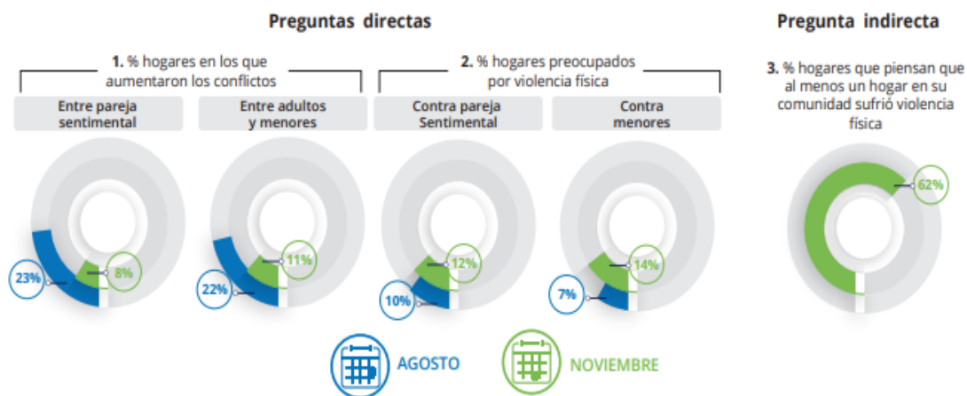
Figura 1. Encuesta de violencia familiar