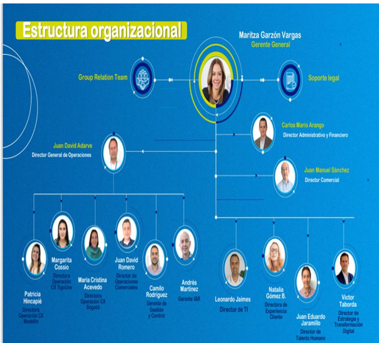
Ilustración 2 Organigrama