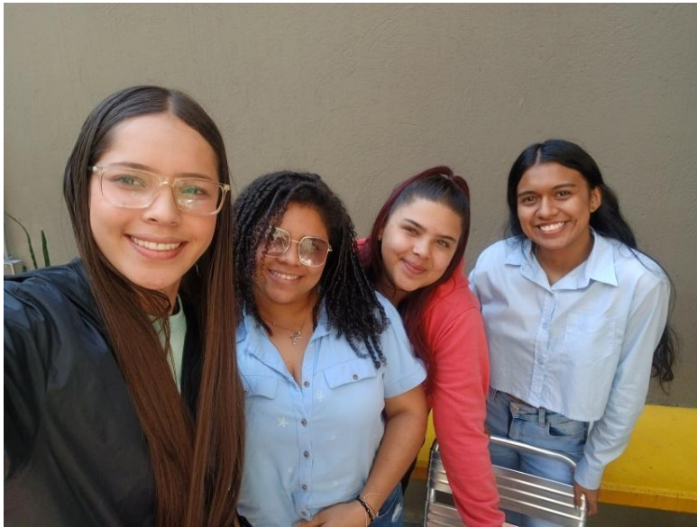
Ilustración 7 Fotos durante el proceso