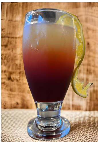
Figura 10. Coctel Strong orange

En agosto, se lanzaron nuevos productos con base en los seleccionados en julio, se creó la Quesadilla 3 quesos, está con la intención de incluir productos sin carne debido a varias peticiones de clientes vegetarianos. Además, se crearon las Brunchetas pepperoni cheese (Figura 11), Brunchetas salami y Brunchetas Honey (Figura 12).