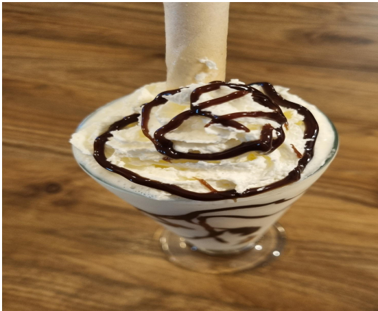
Figura 20. Malteada modificada.