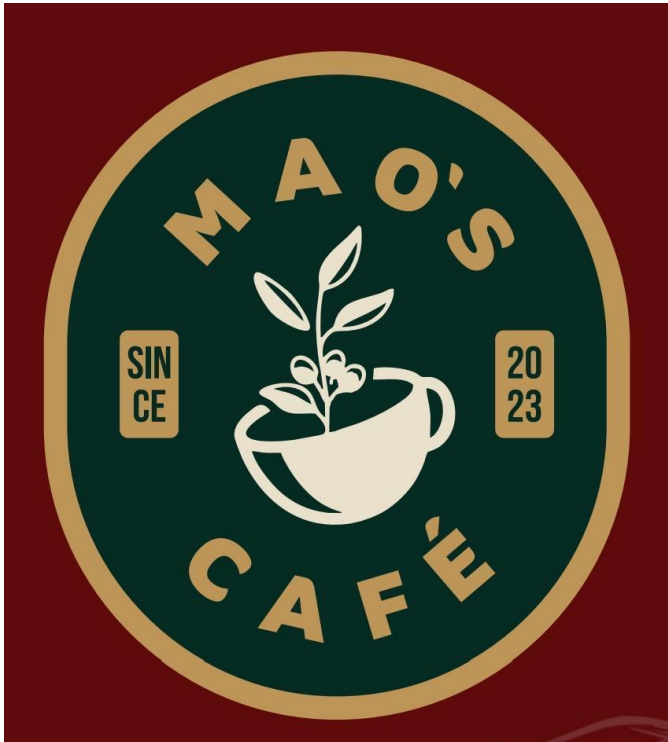
Figura 1. Logo Mao's café.

del establecimiento, ofrecer productos naturales y artesanales, lo cual se interpreta como: “De la plata del café a tu taza de café”.