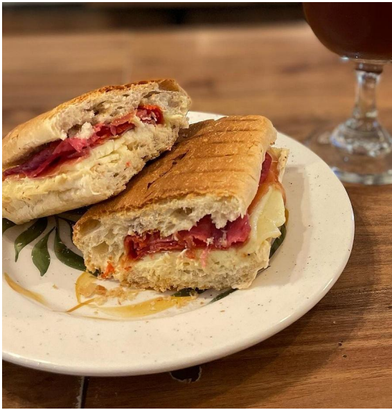
Figura 15. Panini de carnes maduradas.