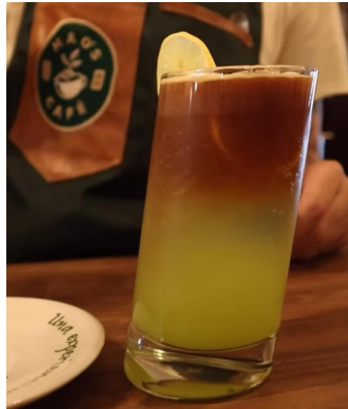
Figura 7. Coctel verano verde.