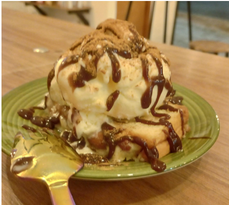
Figura 13. Postre Canela cream.

En este mes, se empezaron a crear postres para ofrecer en Mao's café, la idea era que fueran preparaciones fáciles de elaborar y se pudieran aprovechar ingredientes que ya estaban disponibles, por lo que se crearon el Canela cream (Figura 13) y el brownie con helado (Figura 14).