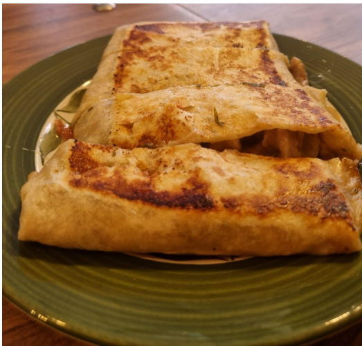
Figura 4. Quesadillas Mao's.

y Brunchetas Pulled pork (Figura 5). Estos 3 tres productos tuvieron buena acogida por los clientes en las primeras semanas de julio, pero con el pasar de los días, las Pitas Mao's perdieron fuerza al presentar problemas en su almacenamiento, el pan pita no podía almacenarse o dejarse al aire libre por más de 3 días, ya que se colocaba duro y no era posible utilizarlo en las preparaciones, por este motivo fue descartada. Por otro lado, las Quesadillas y las Brunchetas, resultaron ser adecuados tanto en preparación, almacenamiento y en ventas, convirtiéndose así en el pilar para los futuros productos que se iban a crear.