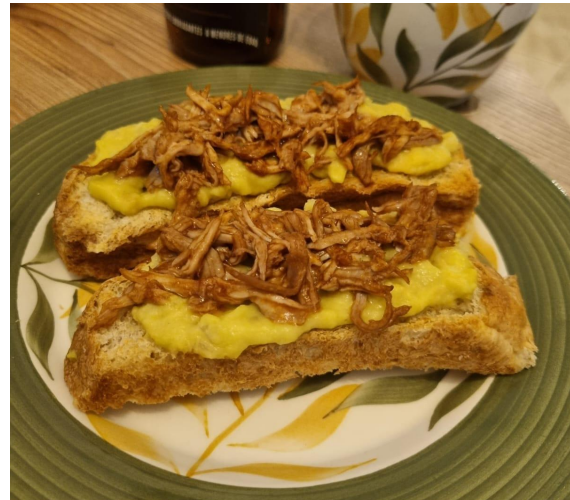
Figura 5. Brunchetas Pulled pork.

Posteriormente, cada semana se propuso la creación de nuevos cocteles que tuvieran café en su composición, aquellas preparaciones que tuvieran buena aceptación por parte de los clientes, medido a través de las ventas que generaban, harían parte del nuevo menú. Esta propuesta dio a la creación varios cocteles, algunos fueron la cerezada de café (Figura 6) y el verano verde (Figura 7), que fueron bien recibidos por los clientes, en cambio, productos como la Tentación Lyche (Figura 8), Lemmon coffe (Figura 9), Bloody orange, Strong orange (Figura 10) y coffred, no fueron bien recibidos por el público, por tanto, no fueron incluidos en el menú final.