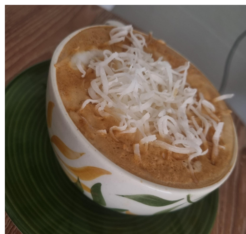
Figura 19. Capuchino de coco modificado.