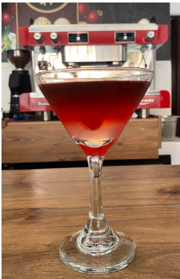
Figura 8. Coctel Tentación de Lyche.