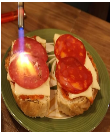
Figura 11. Brunchetas pepperoni cheese.

En agosto, se lanzaron nuevos productos con base en los seleccionados en julio, se creó la Quesadilla 3 quesos, está con la intención de incluir productos sin carne debido a varias peticiones de clientes vegetarianos. Además, se crearon las Brunchetas pepperoni cheese (Figura 11), Brunchetas salami y Brunchetas Honey (Figura 12).