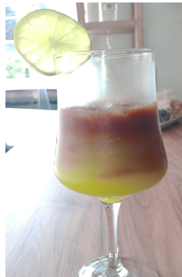
Figura 9. Coctel Lemmon Coffe.