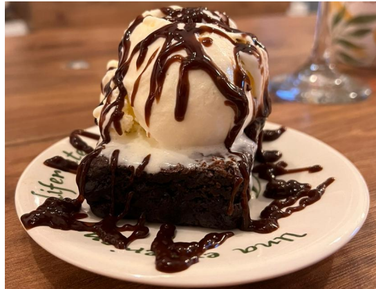
Figura 14. Postre Brownie con helado.

En septiembre, se colocó a prueba otro producto de comida caliente, ya que se quería tener un poco más de variedad dentro de esta categoría. Viendo la oferta de otros cafés se encontró que el Panini era un producto común en algunos cafés. Afortunadamente, los establecimientos cercados a Mao's café, no ofrecían este tipo de preparación, por lo que se vio como una oportunidad para implementarlo, surgiendo así el Panini de carnes maduradas (Figura 15) y el Panini de pollo (Figura 16), productos que fueron muy acogidos por los clientes y que rápidamente se volvieron los más vendidos.