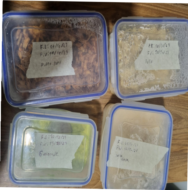
Figura 53. Rotulación de alimentos elaborados.

fecha de elaboración, fecha de vencimiento y nombre del producto (Jami, 2014).