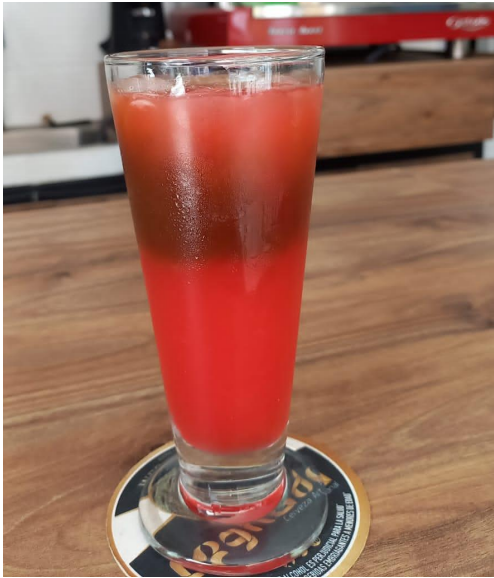
Figura 6. Coctel Cerezada de café