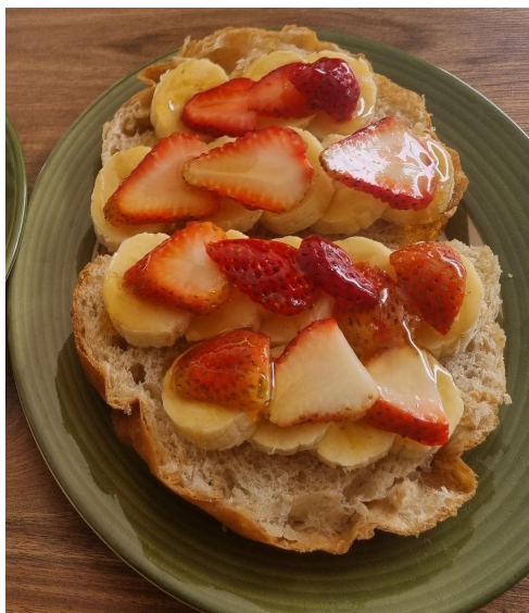
Figura 12. Brunchetas Honey.