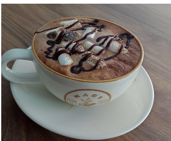
Figura 18. Moccacino modificado.

También, hubo preparaciones que se modificaron para mejorar su presentación y volverlas más llamativas a la vista o para que tuvieran un mejor sabor. Estas fueron el Moccacino (Figura 19), capuchino tradicional, capuchino de coco (Figura 20), capuchino de vainilla, capuchino amaretto, el chocolate caliente, las malteadas (Figura 21), las sodas y el cold brew.