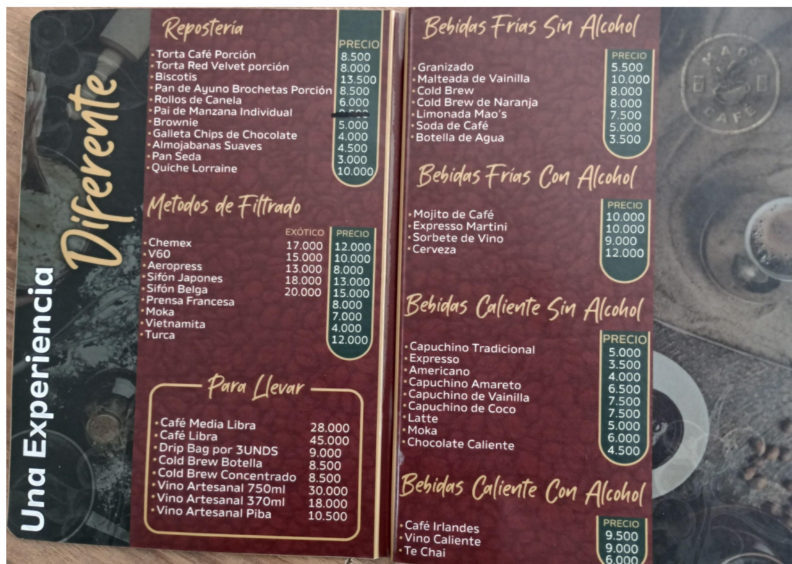
Figura 3. Menú antiguo de Mao's café.

Mao's café, además de tener una oferta muy desorganizada, la tenía muy limitada, lo que hacía que personas con ciertos gustos o preferencias no pudieran consumir algo de su agrado dentro del negocio. Otra problemática, era que no vendían productos variados, por lo que llego a cansar a clientes habituales, haciéndolos solicitar nuevas opciones o más oferta disponible.