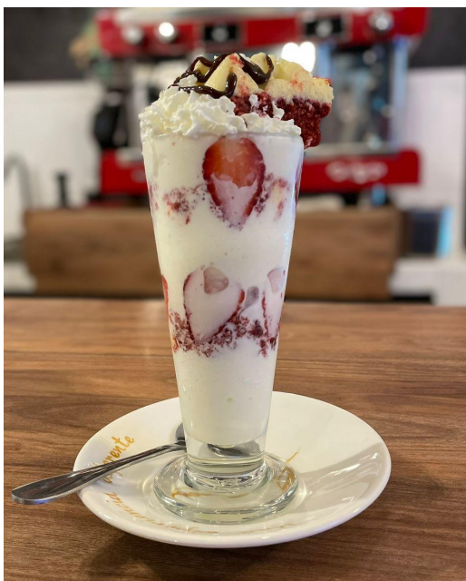
Figura 17. Postre Parfait de torta.