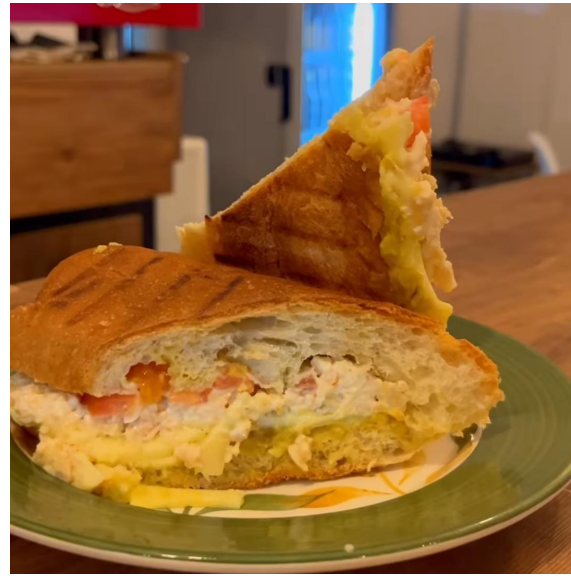
Figura 16. Panini de Pollo.

Con los datos que se tenían de los productos que fueron bien recibidos por el público, se empezaron a crear nuevas propuestas que hacían falta, como: bebidas frías, otras opciones de postres, más oferta en preparaciones con café, entre otras. Estas preparaciones fueron el Parfait de torta (Figura 17), el café dalgona, la torta con helado, el sandwich de helado, la crema de café, el Capuchino con crema de whisky (Figura 18) y el Café Frappé, que se añadieron directamente al menú y se empezaron a vender con la llegada de este.