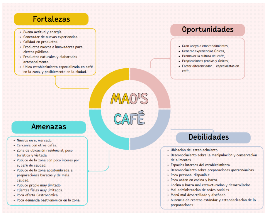
Figura 2. Matriz DOFA de Mao's café.

muy limitada, sus preparaciones eran muy desordenadas, no contaba con espacios aptos para cocinar y no aprovechaban bien sus recursos. Esta idea surgió de aprovechar bien los recursos de Mao's café generando un nuevo menú con una oferta más variada, aprovechando los ingredientes y equipos que tenían disponibles para crear productos nuevos y propios del local, dando más imagen y veracidad a su eslogan.