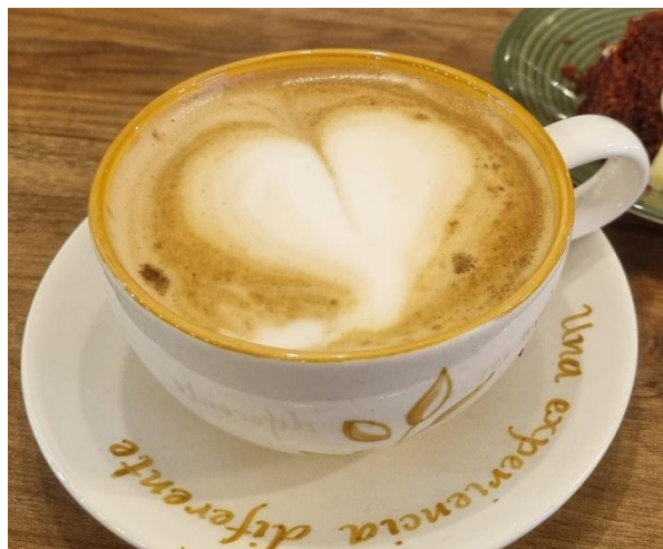
Figura 18. Capuchino con crema de whisky.

También, hubo preparaciones que se modificaron para mejorar su presentación y volverlas más llamativas a la vista o para que tuvieran un mejor sabor. Estas fueron el Moccacino (Figura 19), capuchino tradicional, capuchino de coco (Figura 20), capuchino de vainilla, capuchino amaretto, el chocolate caliente, las malteadas (Figura 21), las sodas y el cold brew.