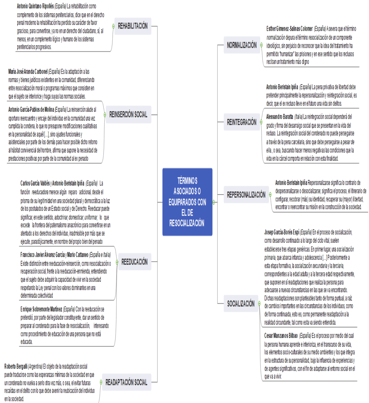
Figura 2. Términos asociados o equiparados a la resocialización

Fuente: elaboración propia datos tomados de (López, 2011)