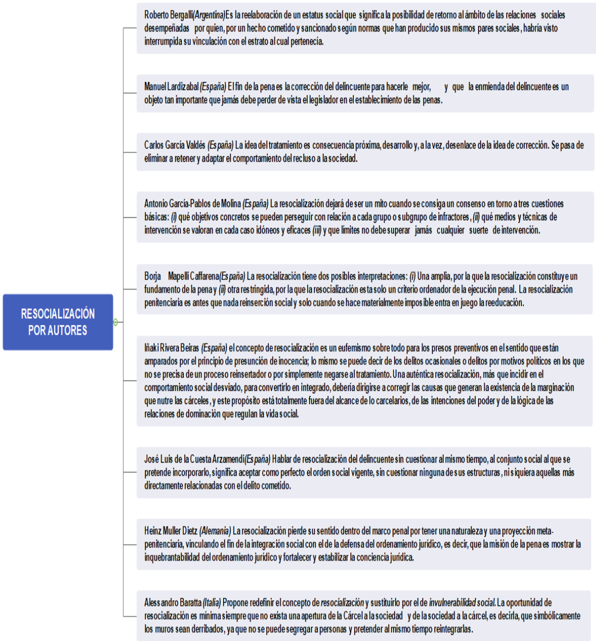
Figura 1. La resocialización por autores