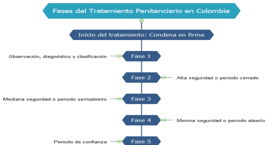
Figura 4. Fases del tratamiento penitenciario en colombia