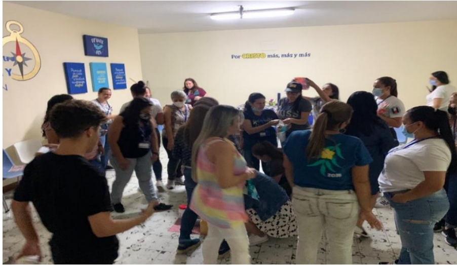
Evento de integración – sesiones preliminares 18/11/2021

Grupo de mujeres resilientes, como ellas mismas se definen, han encontrado la importancia del amor propio, han encontrado esta Sororidad en ellas para salir al mundo y luchar por lo que quieren, desde el inicio del proyecto Soy Tripulante, el propósito fue empoderar estas mujeres guiándolas por medio de talleres y acompañamiento psicoeducativo a tal punto de un conocimiento de sí mismas donde ellas puedan encontrar eso que querían hacer con sus vidas y plasmarlo.