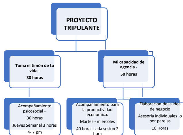
Gráfica N° 1 – Ejes de intervención – Proyecto Tripulantes