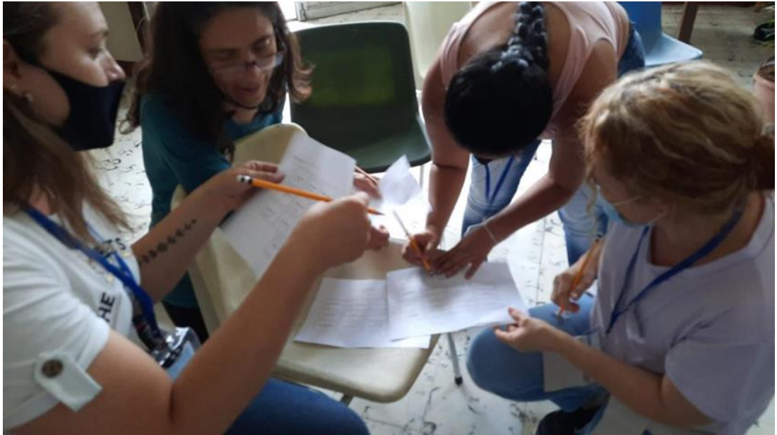
Grupo de estudio – Trabajo con bitácora

utilizaron como método de estudio, este método lo profundizaremos en el siguiente apartado.