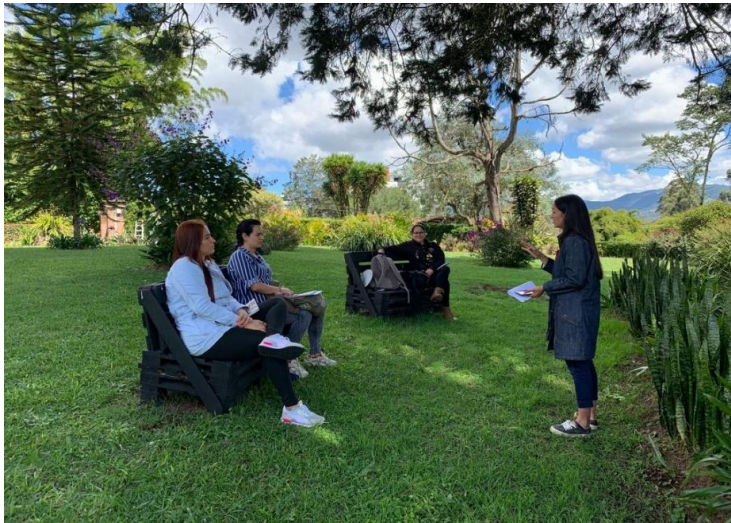
Construyendo los videos para la presentación final. Finca El Shaddai, parcelación el Tambo – la Ceja Antioquia Fecha 28/11/2021

El objetivo de facilitar unas herramientas en el área personal y de emprendimiento para estas mujeres, permitió no solamente en sus propias vidas y en la de sus familias, sino también en la sociedad y que el impacto sea fuerte, por esto cada profesional encargado en el acompañamiento de las mujeres aportó su granito de arena para continuar y sacar el proyecto adelante, por esto los encuentros cuando eran presenciales, eran excelentes con los psicólogos y los temas que trataban, como se fueron acoplando, conociendo y aprendiendo. La presencialidad es muy importante pero además fue la cercanía de los profesionales que estuvieron ahí y los temas que se abordaron todas esas posibilidades fue ascendencia para el crecimiento de las mujeres.