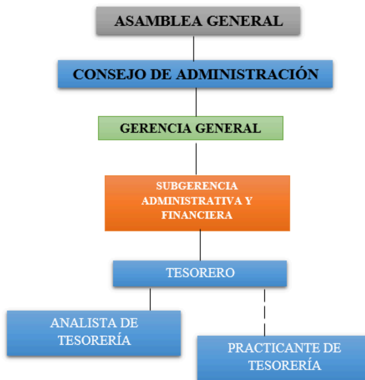
Cuadro resumen del organigrama en la estructura de cargos de la CFA

Elaboración propia a partir de organigrama del área. 2020