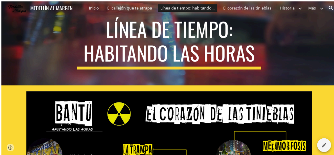
Gráfico 4 Interfaz de crónica escrita (creación propia)