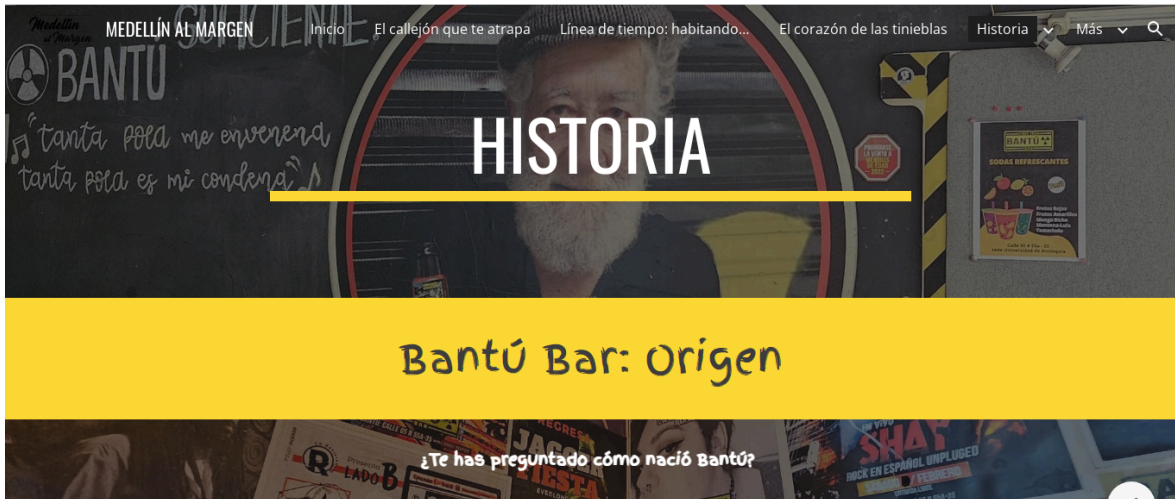
Gráfico 6 Interfaz de sesión de testimonios de quienes frecuentan Bantú