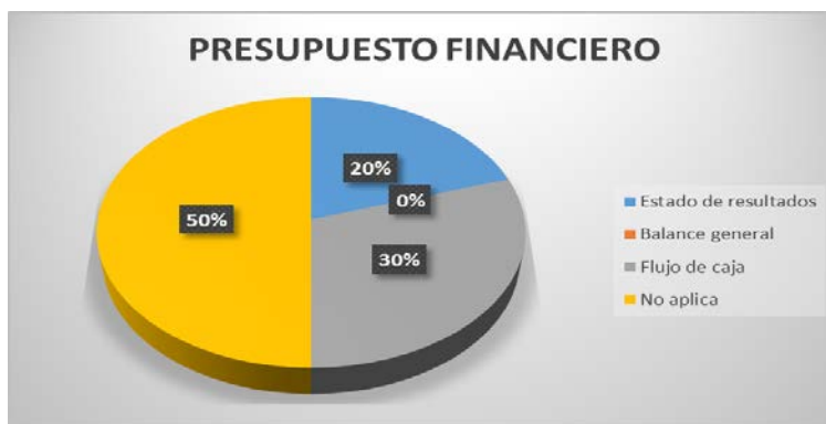
Ilustración 3, Presupuesto Financiero, Elaboración propia.

Tras la anterior tabulación se realizan graficas en cuanto a las respuestas más relevantes para el fin de la investigación, a continuación se presentan: