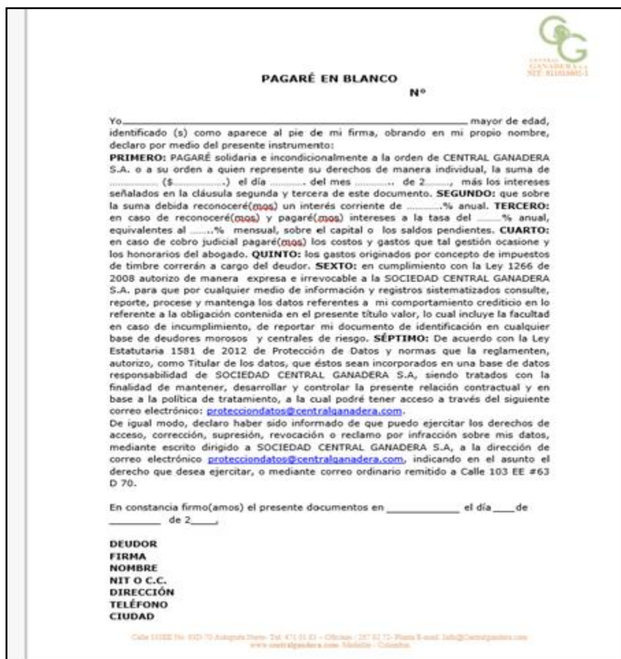
Figura 4. Pagaré en blanco, parte 1.