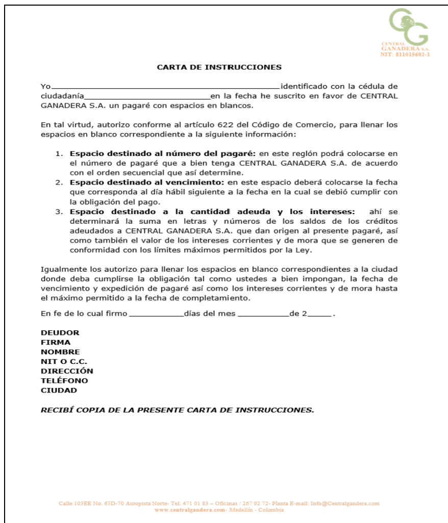
Figura 5. Carta de instrucciones para pagaré en blanco, parte 2.