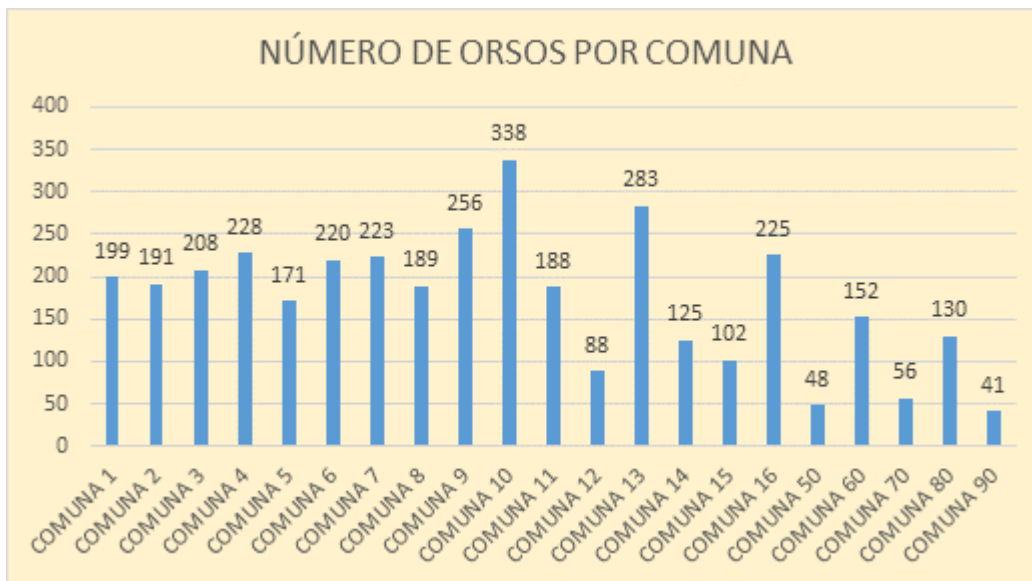
Gráfico No. 2. Organizaciones Sociales por Comuna en Medellín

Fuente: Secretaría de Participación Ciudadana de Medellín (2024)