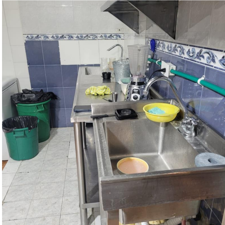
Figura 9 Usos de jabones