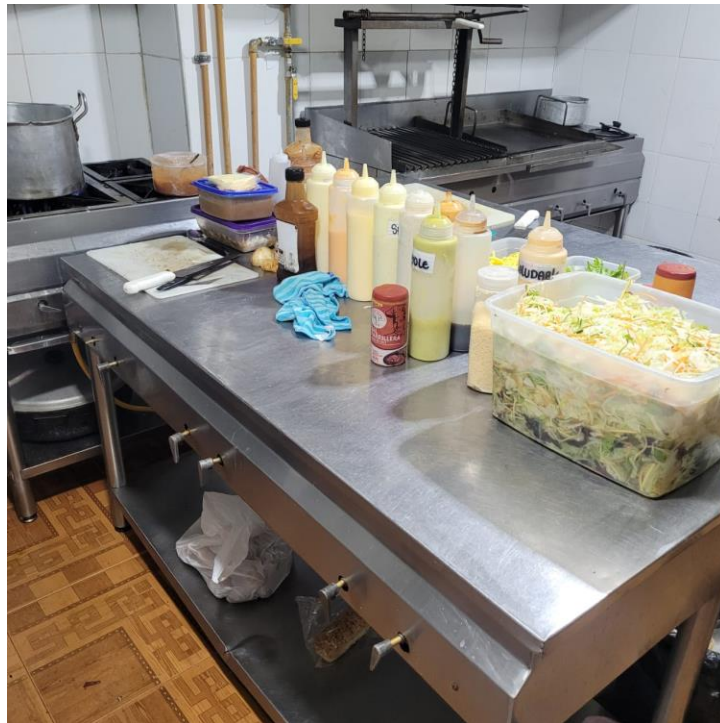
Figura 2 Estado del mesón para la preparación de alimentos