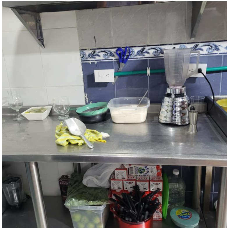
Figura 7 Situación de orden del establecimiento

procedimientos, por esto es que urge que se presente un protocolo a través del cual se puedan generar un manejo mucho más adecuado, en donde se estandaricen los procesos y en donde se pueda visibilizar un orden. Es muy importante ante la llegada de los insumos, concretamente de frutas y verduras, que se presente el debido lavado y desinfección de las mismas ya que gracias a esto se puede garantizar un manejo óptimo que vela por el cuidado y la salud de los clientes, además que genera acciones en función de la calidad de los productos.