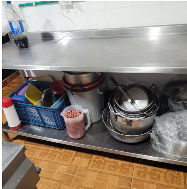
Figura 3 Uso de los espacios

La razón por la cual se necesita limpieza y desinfección es porque no se implementa. Las frutas y verduras no son desinfectadas en el momento de la preparación, solo las limpian con agua pero no tienen un producto como tal establecido para la limpieza y desinfección.