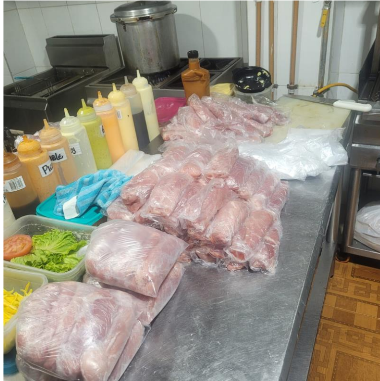
Figura 11 Tratamiento de carnes