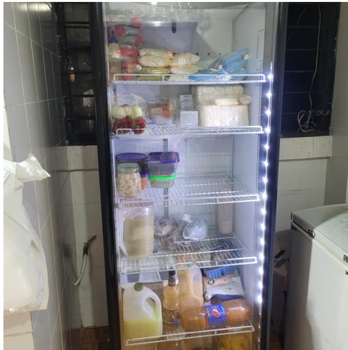
Figura 8 Uso de nevera

utilizados para limpiar, una pala que posteriormente será utilizada para cargar alimentos de diferente tipo, con esto lo que queda en evidencia es la falta de condiciones de higiene y operatividad que adolece el restaurante San Paleste.