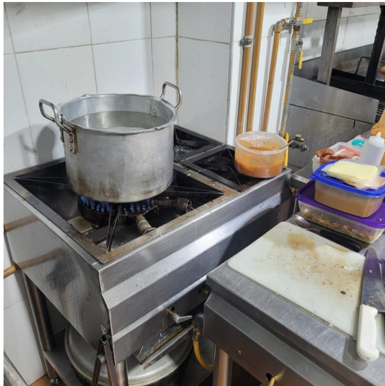
Figura 4 Estado de la estufa

El recipiente plástico que en la fotografía se observa con frijoles no debería estar ubicado en dicho lugar, pero todo esto ocurre debido a que ni los cocineros ni los ayudantes de cocina y mucho menos desde la administración general del restaurante han visibilizado la necesidad de establecer protocolos de maniobra, ubicación temporal y definitiva de los procesos. Muchas veces ocurre que para determinadas funciones como por ejemplo el lavado de los granos no hay un espacio específico en el que se deba desarrollar tal actividad, por ello muchas veces se evidencian rastros de plaga como cucarachas y hormigas, pues no se logra una higiene ni desinfección de la cocina en su totalidad.