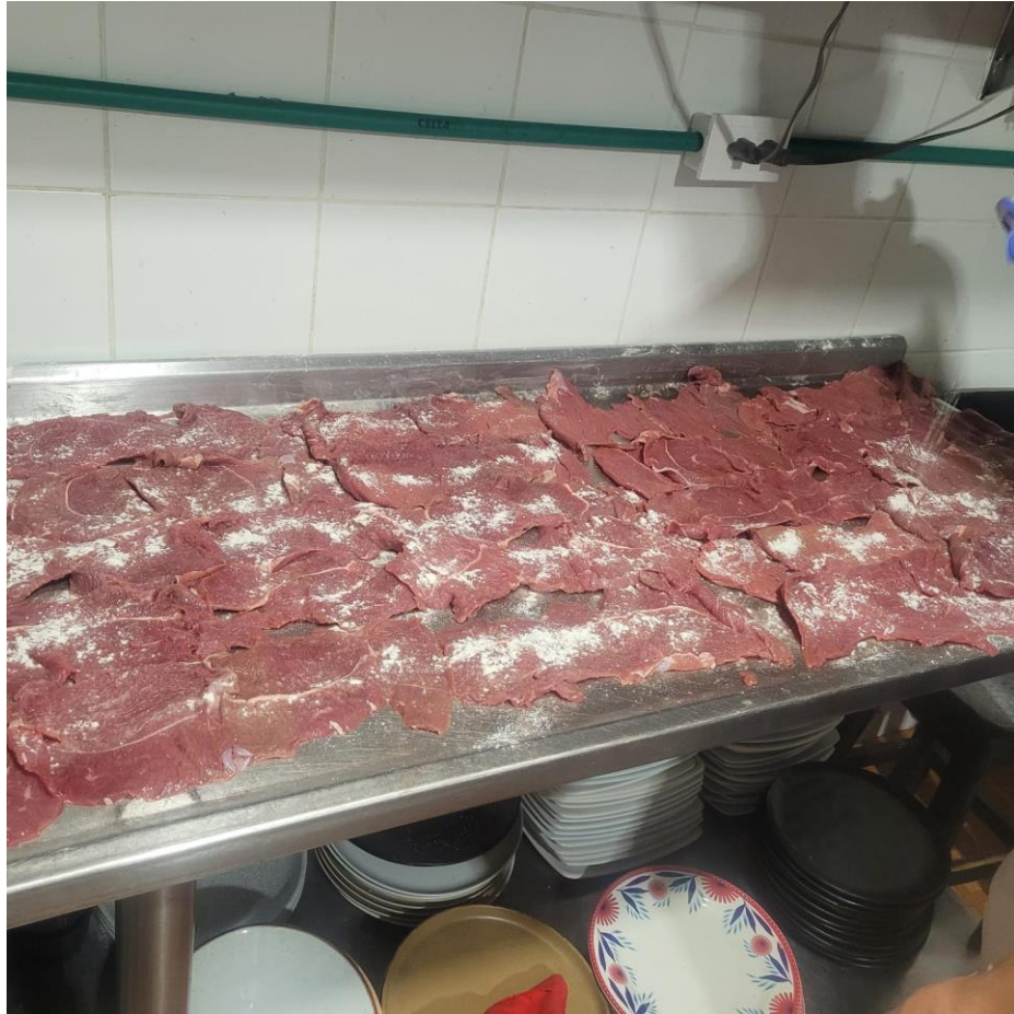
Figura 10 Tratamiento de las carnes