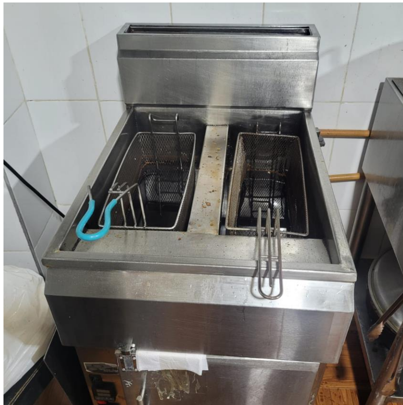
Figura 5 Estado de la fritadora

En la figura 4 se puede evidenciar cómo en la estufa en la que se pone agua a hervir, no se ha llevado a cabo la debida limpieza, esto se debe a que anteriormente se realizó otra preparación y se ensució, pero no fue limpiada antes de continuar con el proceso de cocinar en este caso carne. Asimismo, se evidencia que no hay una disposición precisa de los objetos y demás insumos, por ejemplo, hacia el costado derecho de la estufa se muestra un recipiente con condimentos abierto, muy cercano al borde, situación que no solamente resulta antihigiénica, sino que da cuenta de la falta de logística y de orden a la hora de proceder. También, se ve la tabla de plástico sucia, luego de haber sido utilizada.