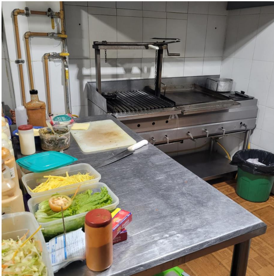
Figura 6 Uso de los plásticos

En la figura 5 se puede apreciar cómo no se genera un proceso de limpieza y desinfección de los utensilios y aparatos para cocinar, en este caso la freidora antes de ser utilizada no fue debidamente limpiada, como se puede ver, en el centro de las dos canastas hay grasa, aceite restante del proceso de fritado del día anterior. Durante el día no se evidencia que se presenten plagas. Sin embargo, por la noche cuando se presenta la oscuridad es el momento en donde pueden aparecer cucarachas o roedores.