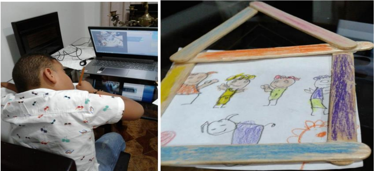
Ilustración 3. Clase virtual y actividades del niño

Otro tipo de necesidades educativas identificadas se refieren a aspectos emocionales/sociales, referidas al hecho de que el niño se motiva al aprendizaje en presencia de sus compañeros o con el acompañamiento y comunicación constante con los mismos.