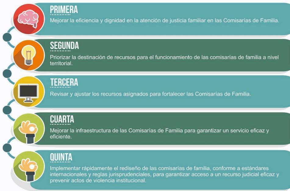
Figura 2. Infograma Resultados, Retos y Recomendaciones.

La construcción de soluciones que giran entorno a la protección de los derechos.