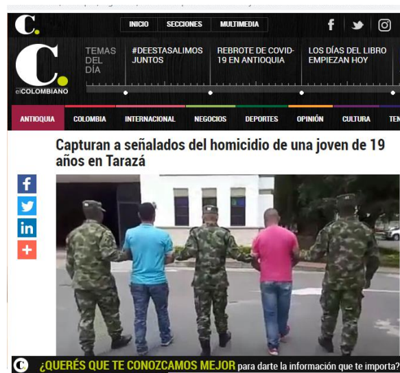
Ejemplo noticia El Colombiano.com 1