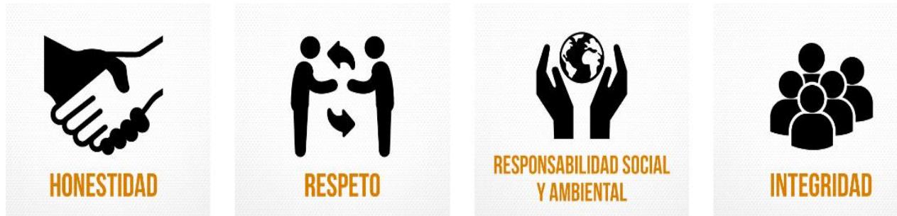
Ilustración 3 Principios éticos