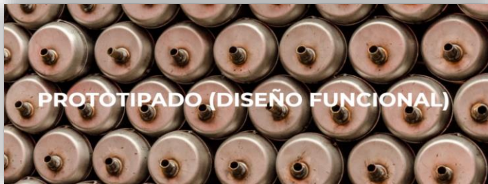
Ilustración 9 Sistemas de escape motocicletas

Sillines (SEKI): En SEKI el cumplimiento de las exigentes normas de calidad de la ensambladoras, las entregas justo a tiempo y la innovación en los diseños nos mantienen en el primer lugar como el mayor proveedor de sillines originales.