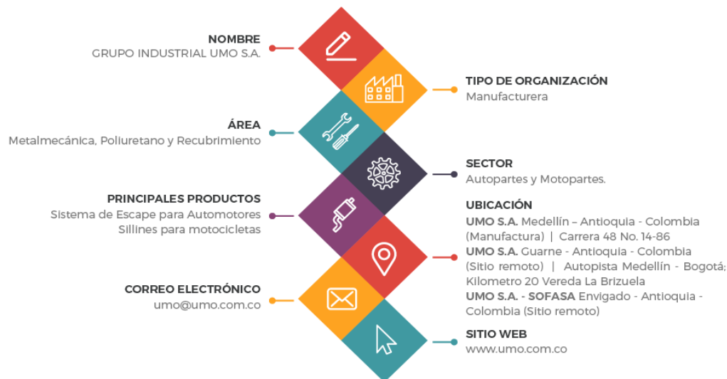
Ilustración 1 Presentación de la organización