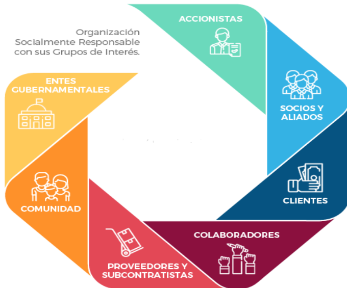
Ilustración 7 Grupos de interés UMO SA