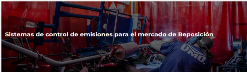
Ilustración 11 Reposición

Reposición: Nuestra experiencia fabricando los sistemas de control de emisiones para los vehículos colombianos nos permite poder tener a la disposición del mercado de reposición un amplio portafolio de producto en ensamble original y universal acorde con los estándares de calidad y funcionamiento de las ensambladoras nacionales.