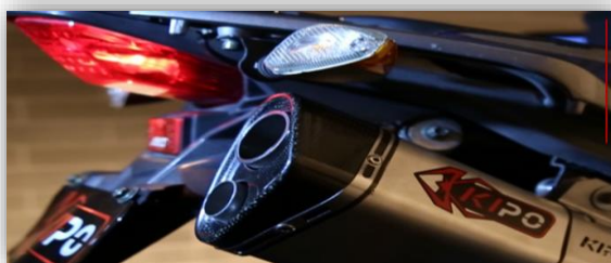
Ilustración 12 KIPO

KIPO: Sistemas de emisión de gases para motocicletas de alto cilindraje.