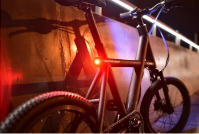
Ilustración 13 Movilidad sostenible bicicleta