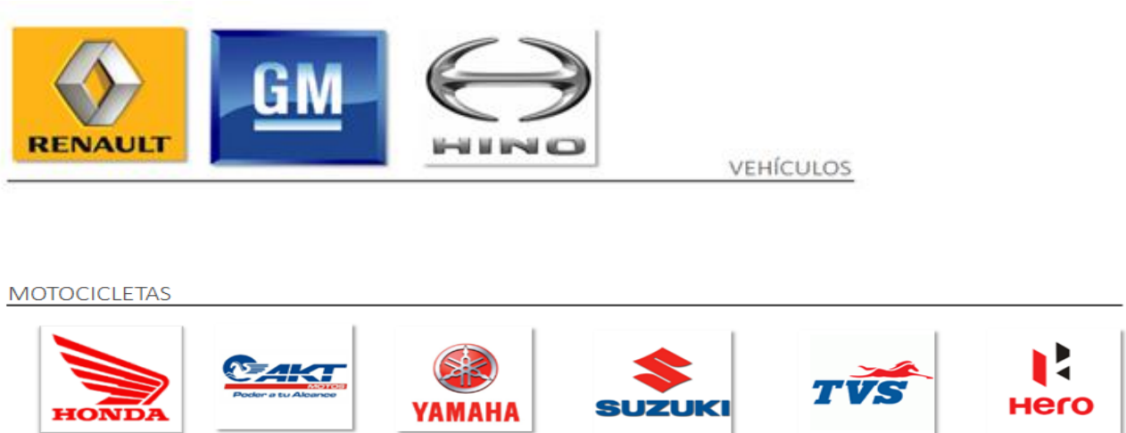
Ilustración 14 Clientes