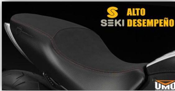
Ilustración 10 Sillines SEKI

Reposición: Nuestra experiencia fabricando los sistemas de control de emisiones para los vehículos colombianos nos permite poder tener a la disposición del mercado de reposición un amplio portafolio de producto en ensamble original y universal acorde con los estándares de calidad y funcionamiento de las ensambladoras nacionales.