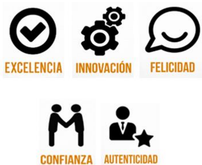
Ilustración 2 Valores corporativos