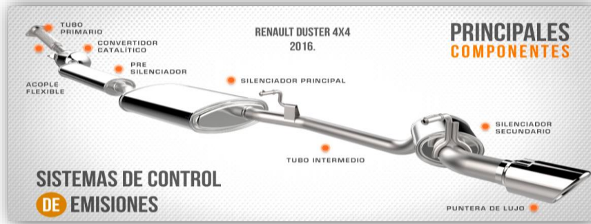
Ilustración 8 Sistemas de escape Vehículos

Vehículos: Sistemas de control de emisiones.