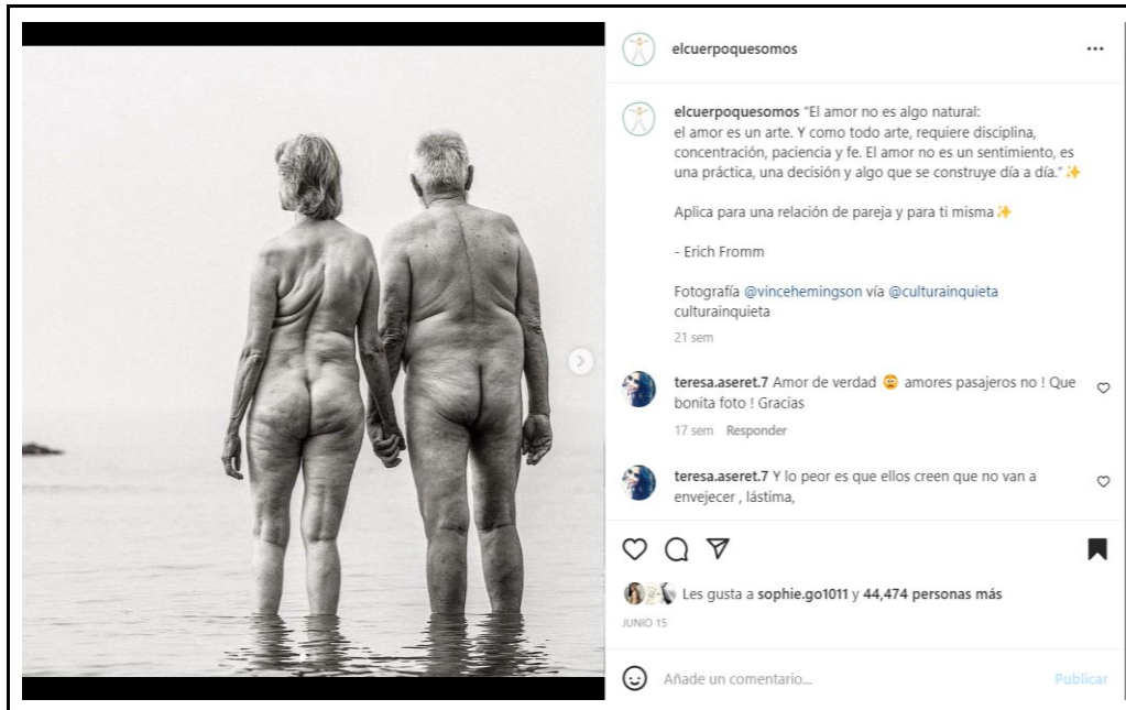
Figura 3, tomada de @elcuerpoquesomos