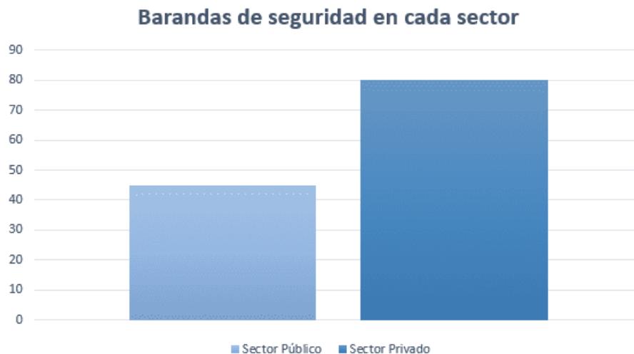
Gráfica 1. Título de la gráfica

en cada sector tienen mucha diferencia en cuanto a cantidad, en el sector público son 45 barandas y en el sector privado son 80 en total.