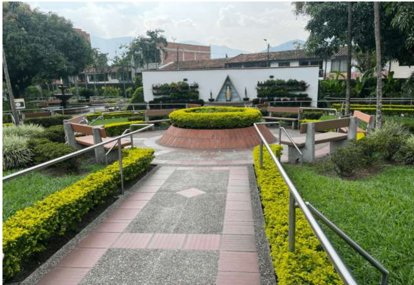
Imagen 1. Zonas comunes del Refugio