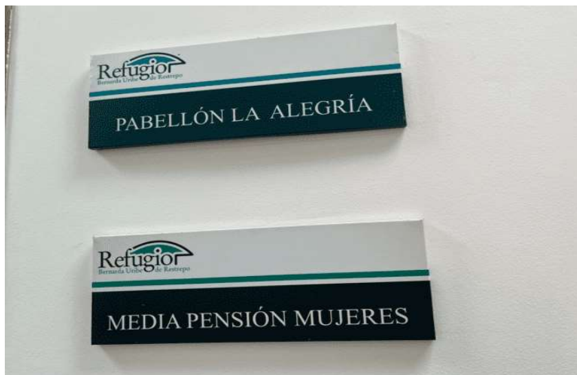
Imagen 2. Referente de señalética del Refugio