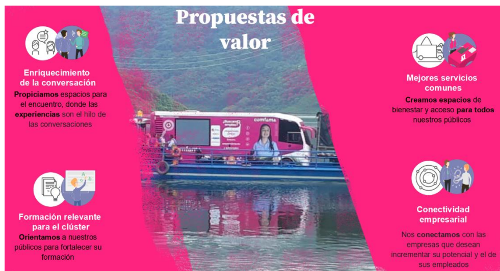
Imagen 2. Propuestas de valor Comfama