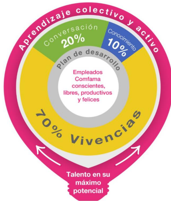
Imagen 3. Aprendizaje organizacional de Comfama