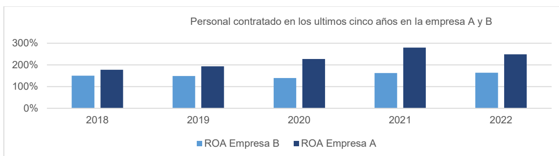
Gráfico 2. Comportamiento del ROA en los últimos cinco años de la empresa A y B

Para la empresa manufacturera ampliar su capacidad instalada, mediante la adquisición de activos fijos ha sido de vital importancia dado que para el año 2022 aumentaron sus ingresos en un 22% respecto al año 2021, y un 59% respecto al año 2019, adicionalmente se espera seguir realizando inversiones en activos fijos reales productivos, dado que la compañía desea aumentar su planta productiva.