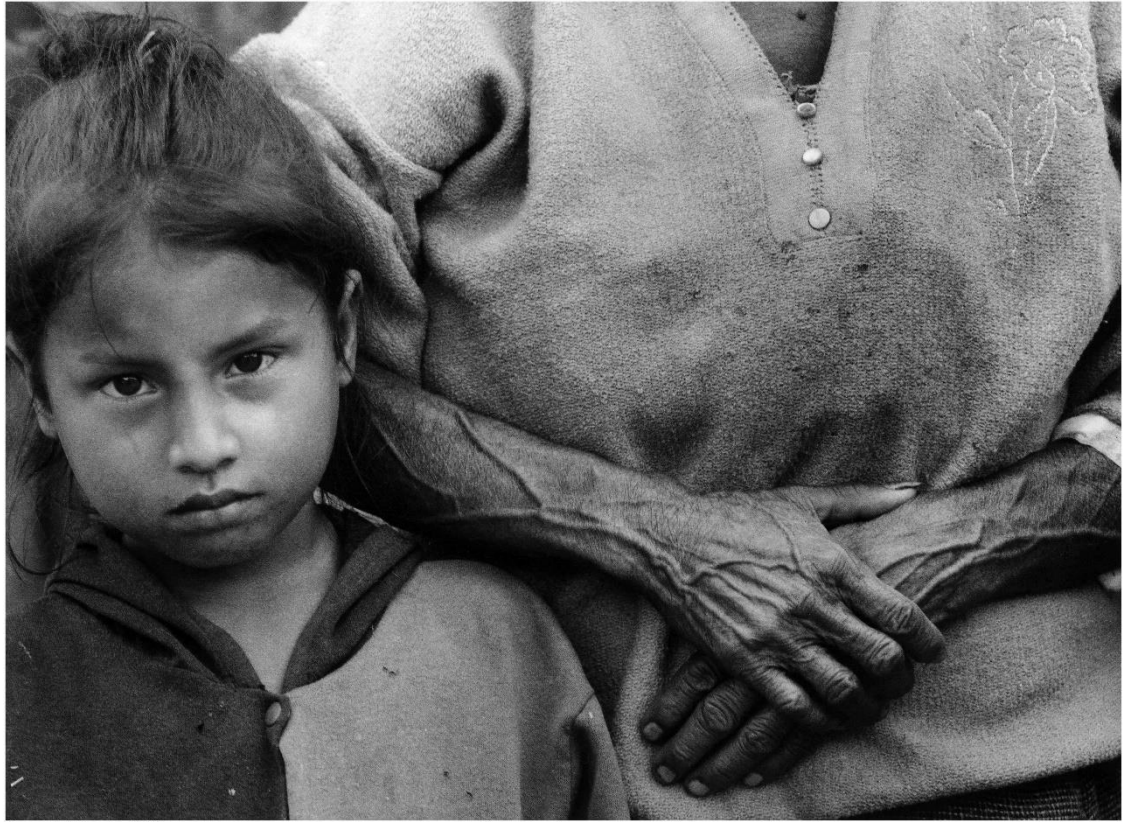
Peque, Antioquia. 2001