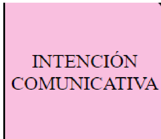
Tabla 9. Intención comunicativa

Teniendo en cuenta que todos los elementos del discursos pedagógico no son utilizados arbitrariamente, sino por el contrario tienen un objetivo claro en el desarrollo de cada capítulo se da una intención comunicativa sólida y esto hacen que la intención o finalidad del tema del capítulo sea llevada a cabo, esto también permite que el programa cumpla su objetivo principal