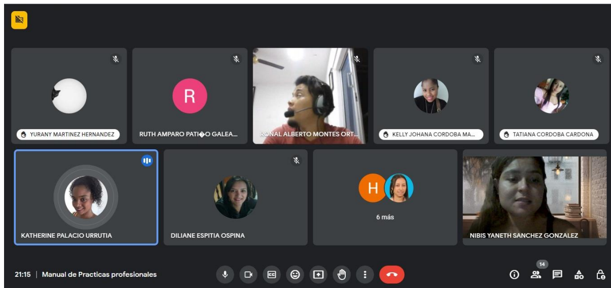
Ilustración 1 Desarrollo y socializacion Encuesta