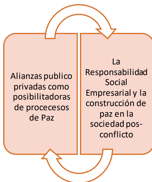
Grafico 2: Unidad de análisis

La unidad de análisis de la presente investigación se configuraron a partir de las siguientes dos Macro-categorías, las cuales se interrelacionan continuamente.