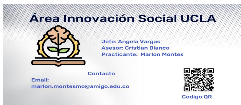
Imagen 3: Imagen publicitaria área innovación social UCLA 2023-02: QR para unirse al grupo de WhatsApp y correo electrónico para el contacto directo con el practicante encargado, en este mismo modo se realizaron las IECARD para invitarlos a los talleres del área.

En la imagen presentada a continuación se encontrará el QR de vinculación al canal de WhatsApp la cual será enviada al correo institucional con los estudiantes que conforman la base de datos.