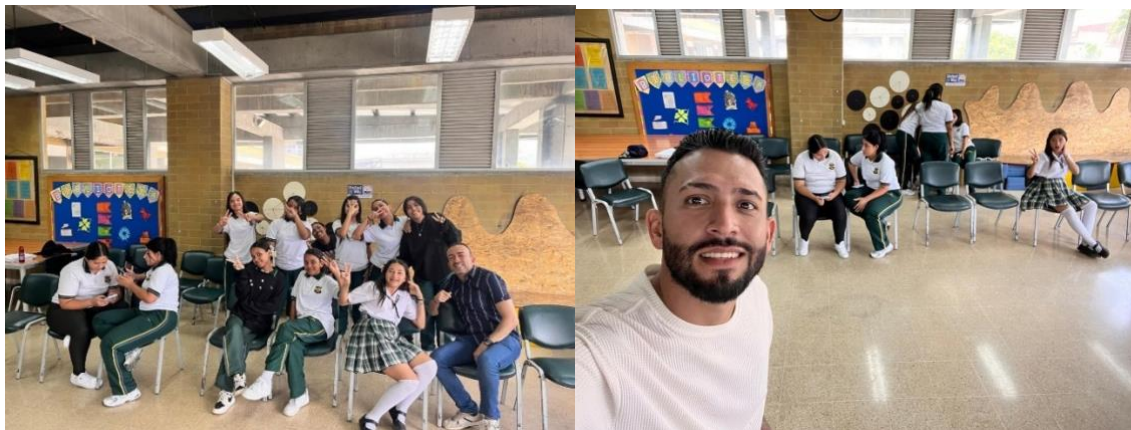
Primer encuentro conociendo el equipo / Actividad construcción de una noticia De trabajo para ser presentada ante los compañeros

Evidencia fotográfica de las actividades realizadas en clase