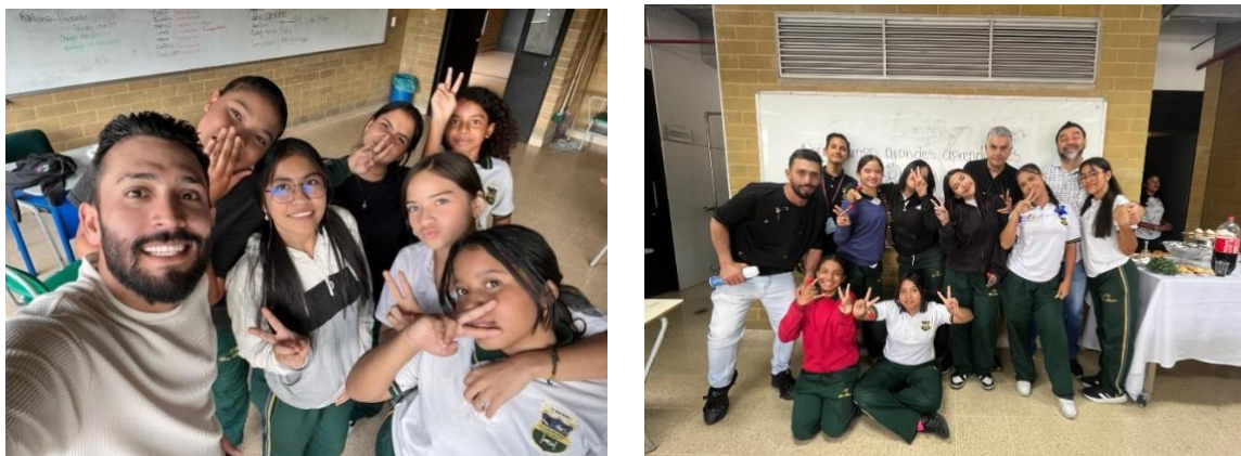
Actividad de Improvisación manejo De la voz a través de trend de Tik tok Socialización en el último encuentro con los estudiantes del Semillero