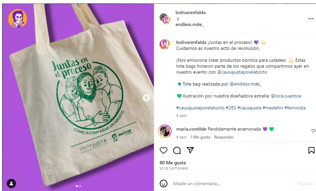
Carrusel del 30/09/2023

Estas alianzas se reflejan en continuas publicaciones en colaboración con otras organizaciones e historias compartidas que promueven el trabajo conjunto de eventos y proyectos relacionados con la visibilización de violencias de género u otros, como es el caso de este carrusel en el que enseñan una tote bag que realizaron en conjunto con el colectivo causa justa por el aborto: