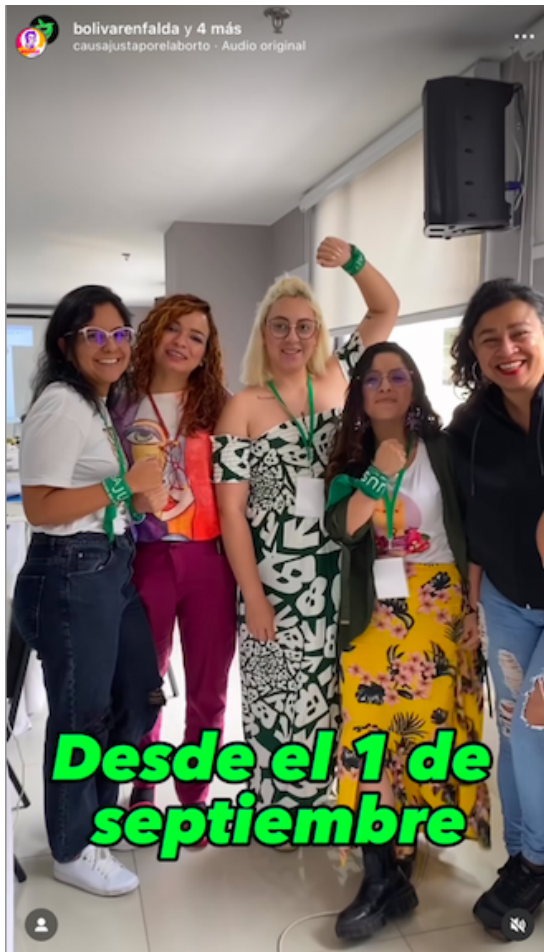
Reel del 3/9/23 con el audio desde septiembre se siente que viene el 1 el #28S