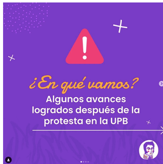
Carrusel del 27/03/2023

visibilización de los casos expuestos en la cuenta de Bolívar en falda, se han instalado mesas en instituciones educativas para impulsar rutas por violencias de género y protocolos para activar un caso. Como sucedió en la Universidad Pontificia Bolivariana que impulsa las rutas por violencias de género en el campus académico y de esta forma hacen rendición de cuentas en este carrusel: