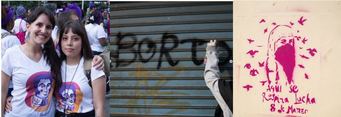
Carrusel del 10/03/19 (figuras 1, 2 y 3)

Estas marchas motivadas por el día de la mujer son un espacio que levantan fibras e incitan a protestar por la injusticia, la desigualdad, la violencia de género, entre otros temas. Las imágenes del carrusel se vinculan gráficamente con la protesta que pretende dejar un mensaje en rostros y marcas en los muros, es el sentir de las participantes de expresar lo que por siempre ha permanecido en silencio. Cabe resaltar que este carrusel tuvo algunos comentarios en contra por motivo de las acciones que se realizaron sobre las calles y edificios por los que transitó la manifestación.