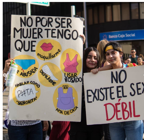
Carrusel del 10/03/19 en el marco del #8M