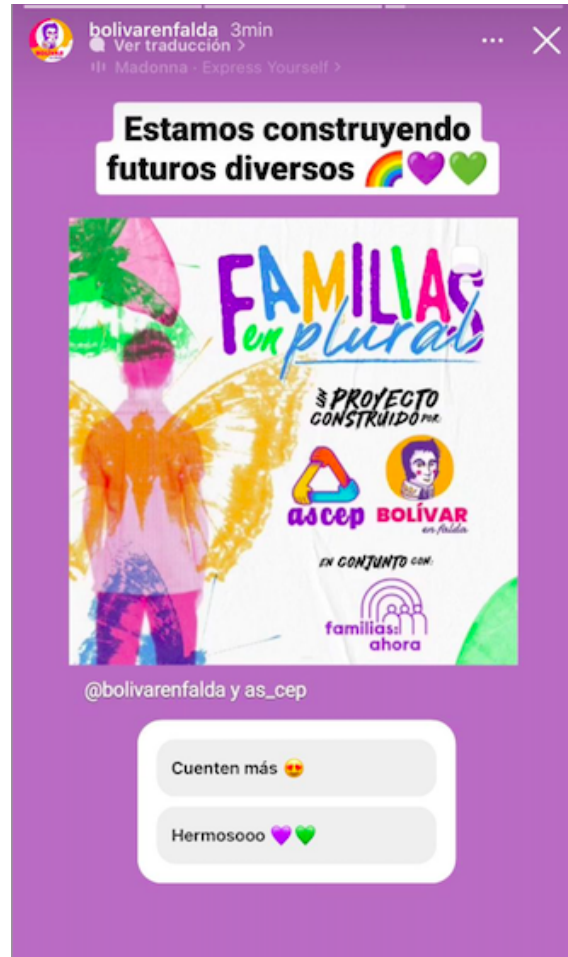
Storie del 12/9/23 con encuesta como acción de interacción.