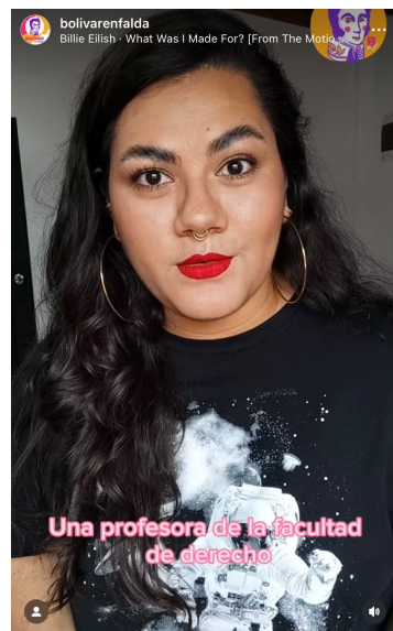
Reel del 04/08/2023 que rechaza las violencias de género en la Universidad de Medellín

Visibilizar en vez de denunciar, ya que las denuncias no son el ejercicio que hace el colectivo y en esto fueron enfáticos durante la entrevista. Muchas de las víctimas acuden a Bolívar en Falda a modo de catarsis, son mujeres que quieren contar su caso, recibir apoyo y que el suceso sea ejemplo para otras mujeres. Las víctimas tienen libertad de tomar acciones legales y para esto, el colectivo cuenta con varios mecanismos, pero son ellas quienes toman la decisión de hacerlo o no, ya que entran en juego varias aristas como por ejemplo que los procesos son engorrosos, involucran a un superior académico, el docente de la clase, o la beca para algunas estudiantes.