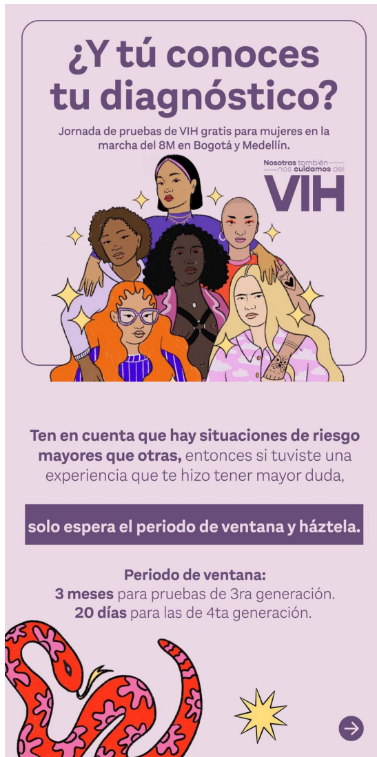
Carrusel del 27/02/23 que explican la importancia de hacerse la prueba de VIH