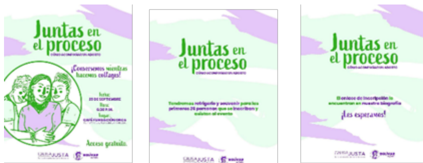
Carrusel 21/9/23 @causajustaporelaborto Likes: 222

Para Bolívar en Falda, estar presentes en eventos donde su esencia marque la claridad de la libertad de género es relevante. El post del mes de septiembre, cerca del día del Grito de la Independencia de México, sirve como referencia a la publicación en la que se ondea una bandera de México y se destaca que este país ya ha despenalizado el aborto a nivel federal, acompañado por el hashtag #ConLaFaldaBienPuesta. Este tipo de contenidos político-sociales son ejemplos claros de cómo Bolívar en Falda prepara los posts con mensajes que lleguen a la población de una manera amable y pedagógica, permitiendo que aprendan sobre diferentes temas, resaltando el cuidado del contenido para que no resulte ofensivo.