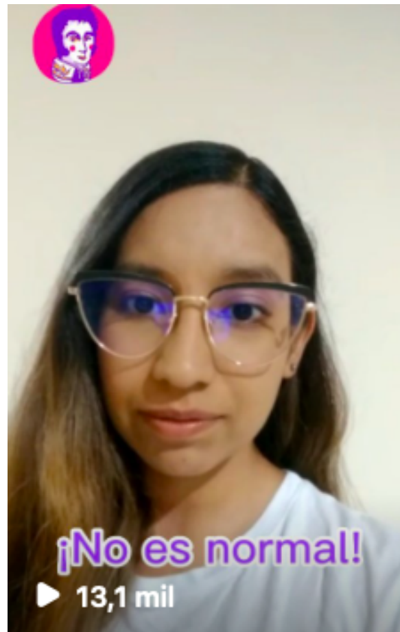
Reel del 15/4/23 con frases que predominan como: "no es normal"

Por otra parte, la estrategia de visibilización es usada por el colectivo con el fin de rechazar y hacer eco de casos de VBG. Algunos ejemplos de visibilización son: el reel del 04/08/2023 en el que las integrantes del colectivo rechazan las violencias de género en la Universidad de Medellín; el carrusel del 10/03/19 en el marco del #8M que está compuesto por nueve imágenes de carteles que contienen mensajes como “no existe el sexo débil, no