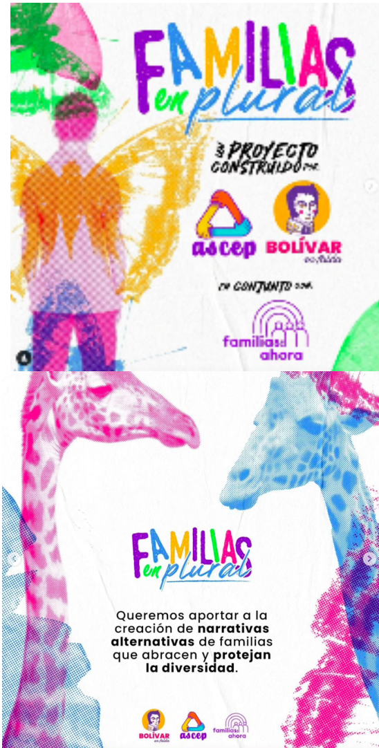
Post del 23/8/2023 con el audio desde septiembre se siente que viene el 1 el #28S

estratégicas que ha hecho con otros colectivos y de esta manera, favorece la creación de un activismo feminista activo que trasciende la esfera offline a online .