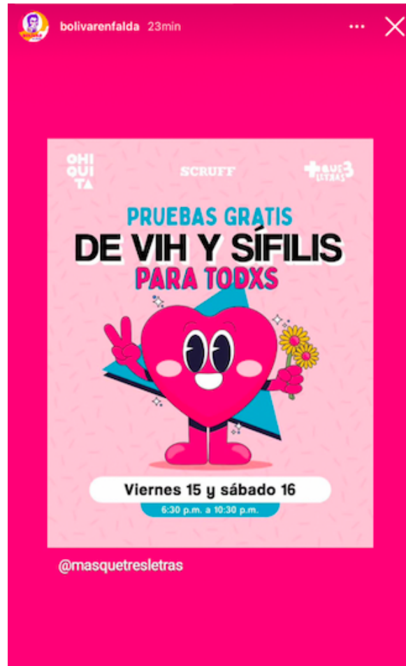
Storie del 15/9/23 que promueve la realización de las pruebas gratis de VIH y sífilis en el Bar Chiquita

Finalmente, la estrategia de comunicación de carácter informativo es aplicada por Bolívar en Falda cuando buscan comunicar proyectos, alianzas o hechos noticiosos que tienen relación con el activismo del colectivo. Un ejemplo es el post y repost con storie del 23/8/2023 en la que informan del proyecto Familias en Plural, construido por la Asociación Colombiana de Egreso de Protección Estatal y Bolívar en falda para aportar a la creación de familias con diversidad. Con esta estrategia, Bolívar en Falda ha dado a conocer alianzas