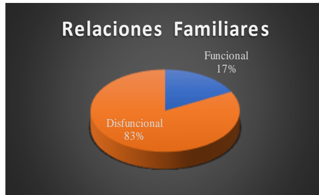
Gráfico 3. Relaciones familiares