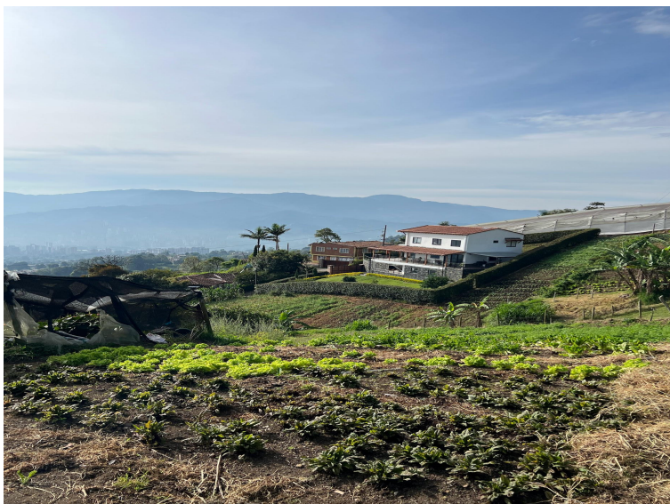
Imagen 3: Productor Reynaldo Castaño Salinas.