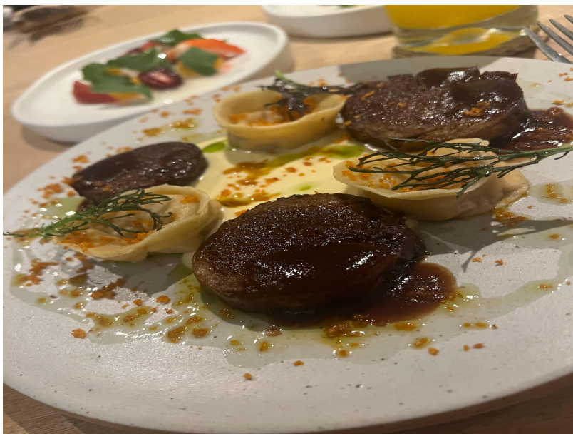
Imagen 5: Plato finalizado.

El anterior plato se presentó ante un panel de personas expertas en el medio gastronómico para aprobar o desaprobar la creación, evaluando así diversos conceptos que se les dieron a evaluar según el siguiente formato: