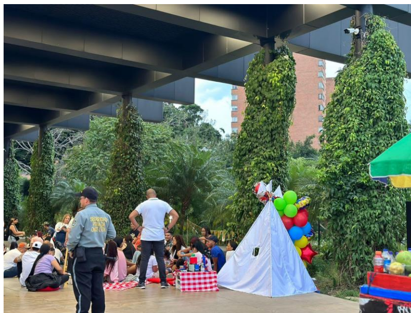
Imagen 3. Evento social

“Parques del Río lo describo como un proyecto muy bonito para la ciudad, porque también le favorece mucho a las personas en economía, también le favorece mucho a que Medellín sea un lugar sostenible en naturaleza, le favorece también mucho al comercio, también a los animalitos, porque también es un espacio para los animales, entonces lo describo también como un proyecto muy bonito para la ciudad”. (V20F, empleada, 2023).