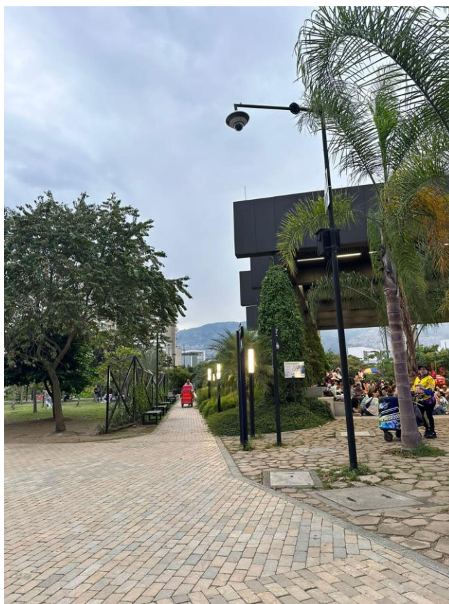
Imagen 1. Cámara de seguridad en Parques del Río

El relato anterior refleja el sentir de seguridad que diversas mujeres que frecuentan Parque del Río comparten de manera conjunta respecto al sentirse seguras durante el tiempo de visita en el parque. El factor principal relacionado con la seguridad radica en la presencia del personal de vigilancia, ya que esto se mencionó por un gran número de mujeres durante las entrevistas realizadas.