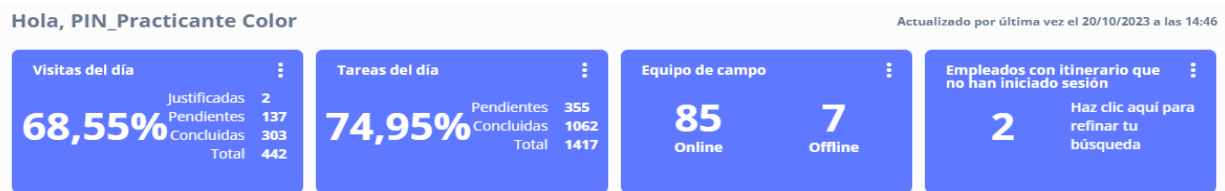
Figura 11. Menú involves stage

En esta plataforma se realiza una labor más sencilla, en este caso lo que se hace es responder a la solicitud de las tiendas y cadenas de todo el país en cuanto a los elementos de color que necesiten para sus respectivas tiendas, lo que más se solicitan son cartas y tendencias. Sin embargo, estos envíos no se pueden realizar cada que los soliciten, debido a que este tipo de envíos, mejor llamados envíos masivos solo se realizan 4 veces por año, uno cada trimestre.