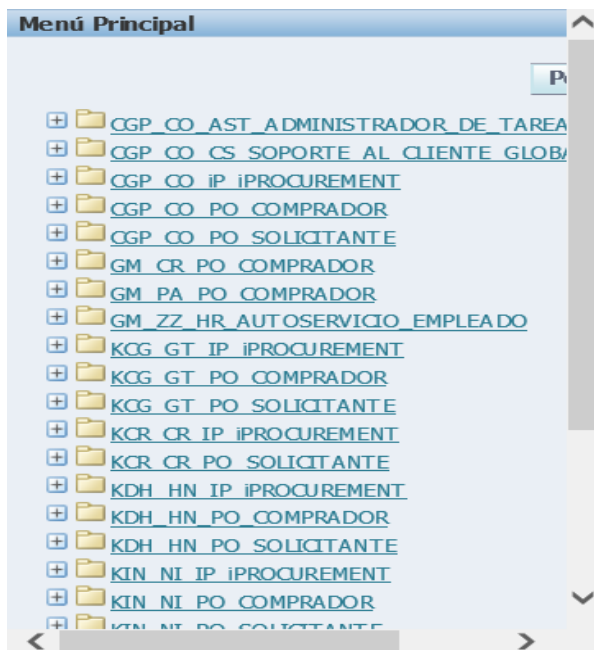
Figura 7. Menú principal Orbis

Por otra parte, se encuentra el listado de trabajo, en este se evidencian las labores realizadas anteriormente y se encuentran ya aprobadas.