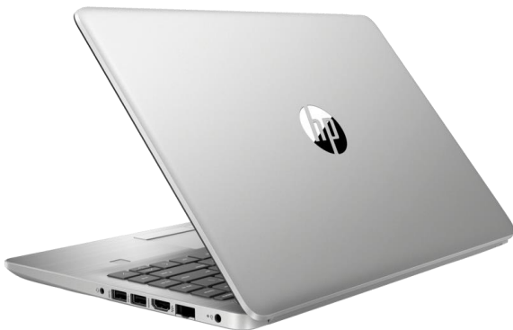
Figura 1. Herramientas de trabajo 1