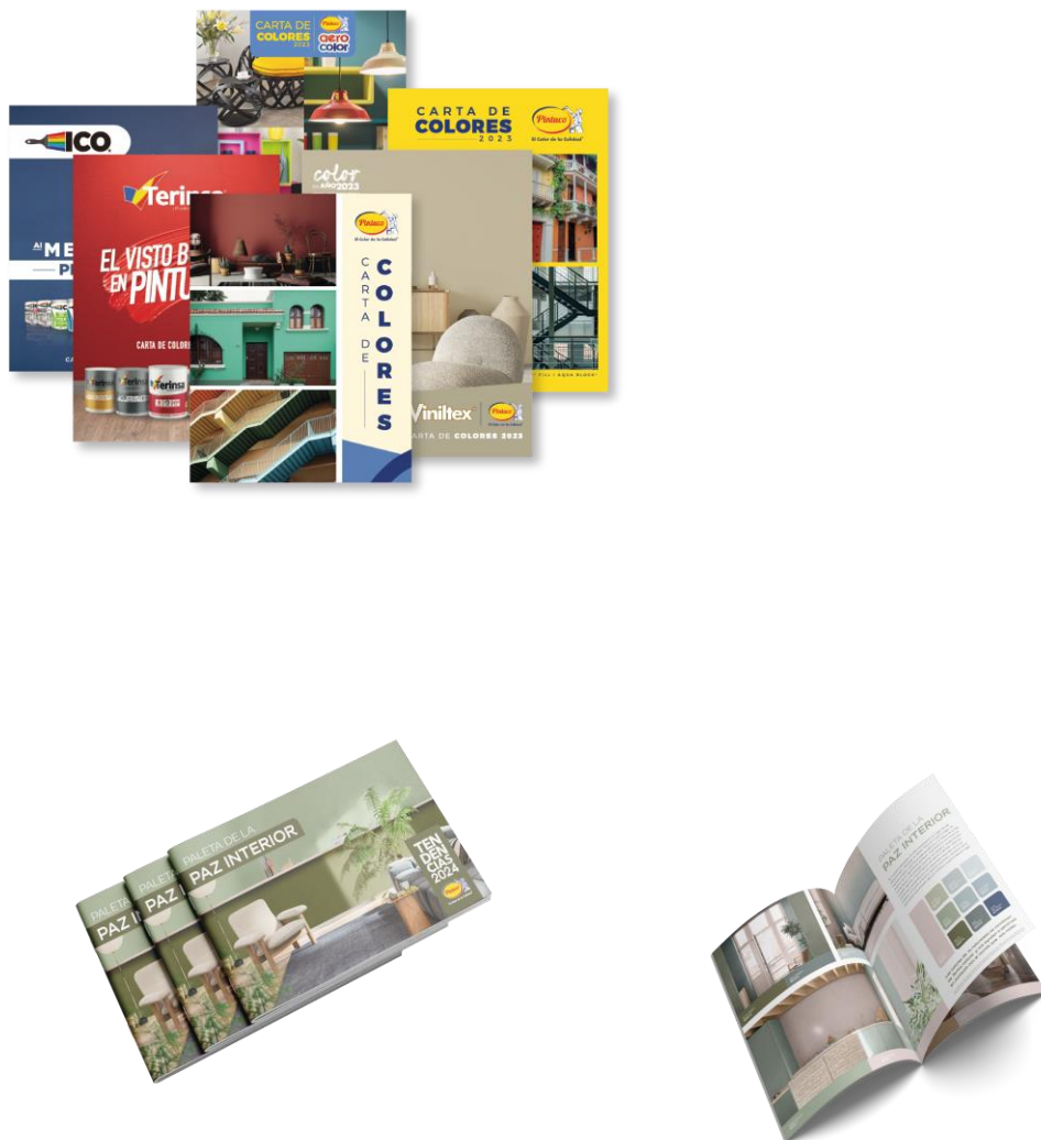
Figura 13. Documentación comercial

Existen otros elementos complementarios que siguen siendo muy importantes para el área y en general para toda la compañía, se trata de las cartas de color, las tendencias y los abanicos, materiales indispensables que se le envían periódicamente a cada tienda Pintuco del país, ya que son las guías necesarias para que los clientes puedan llegar con más facilidad al color o tono que desean comprar, sea cual sea su necesidad existen muchas guías que les permiten identificar el color ideal. Existen guías para Casas, Edificios, Interiores, Exteriores, Sector automotriz, Superficies de madera, etc.