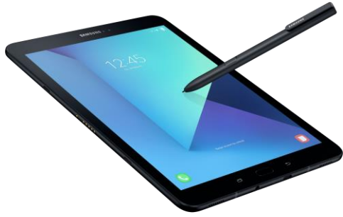
Figura 2. Herramientas de trabajo 2