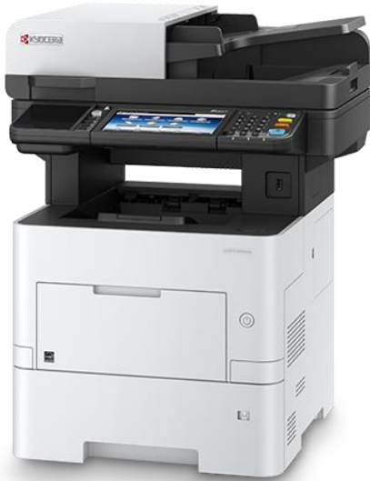
Figura 4. Herramientas de trabajo 4

Básicamente estas 4 herramientas son de las más importantes a la hora de realizar la labor en el área de Practicante de color.