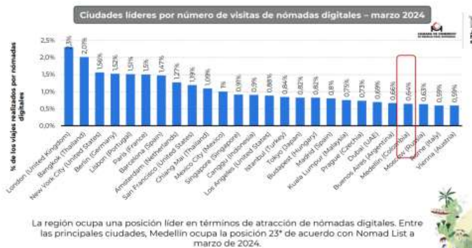
Tabla 2: Ciudades líderes por número de visitas de nómadas digitales.