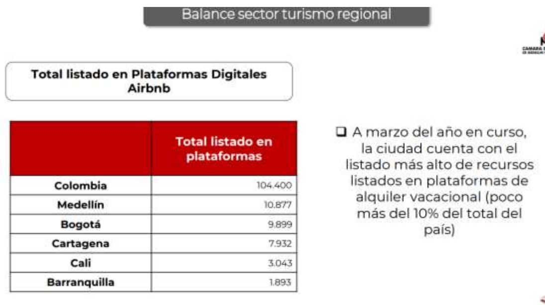
Tabla 3: Total listado en plataformas digitales Airbnb.