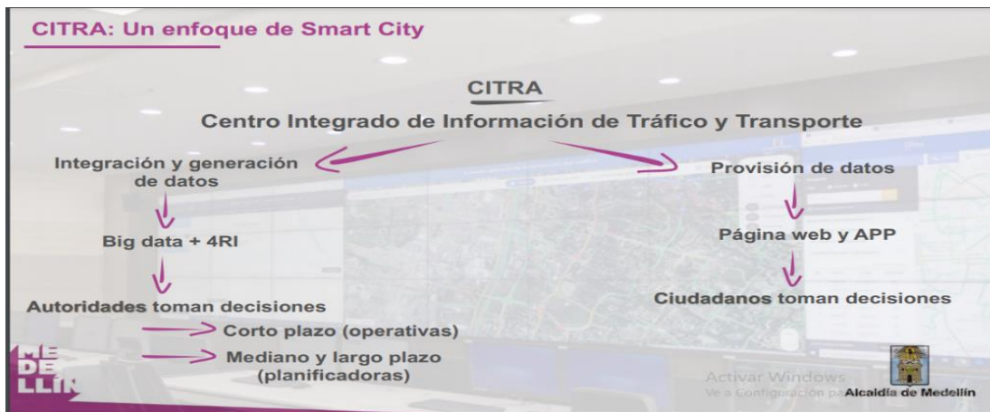
Gráfica # 1.

En efecto, estas iniciativas y proyectos que se han desarrollado y se vienen desarrollando en materia de movilidad, con el apoyo y uso de las TIC y la IA, contribuyen al mejoramiento de la administración pública, permitiendo un mejor tráfico de desplazamiento urbano en la ciudad, así como también agilizar los tiempos de respuesta en lo que corresponde al procedimiento administrativo sancionatorio y de cobro coactivo del título III y IV de la Ley 1437 de 2011, de manera que el funcionario o agente de tránsito pueda apoyarse en las tecnologías emergentes y la inteligencia artificial para tomar decisiones operativas y planificadoras a partir de esos datos.