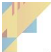
Ilustración 9 Mandamiento de pago final

Al finalizar se imprimen y la respectiva Secretaria de Hacienda y Desarrollo Económico los firma y se procede a realizar la entrega a cada deudor.