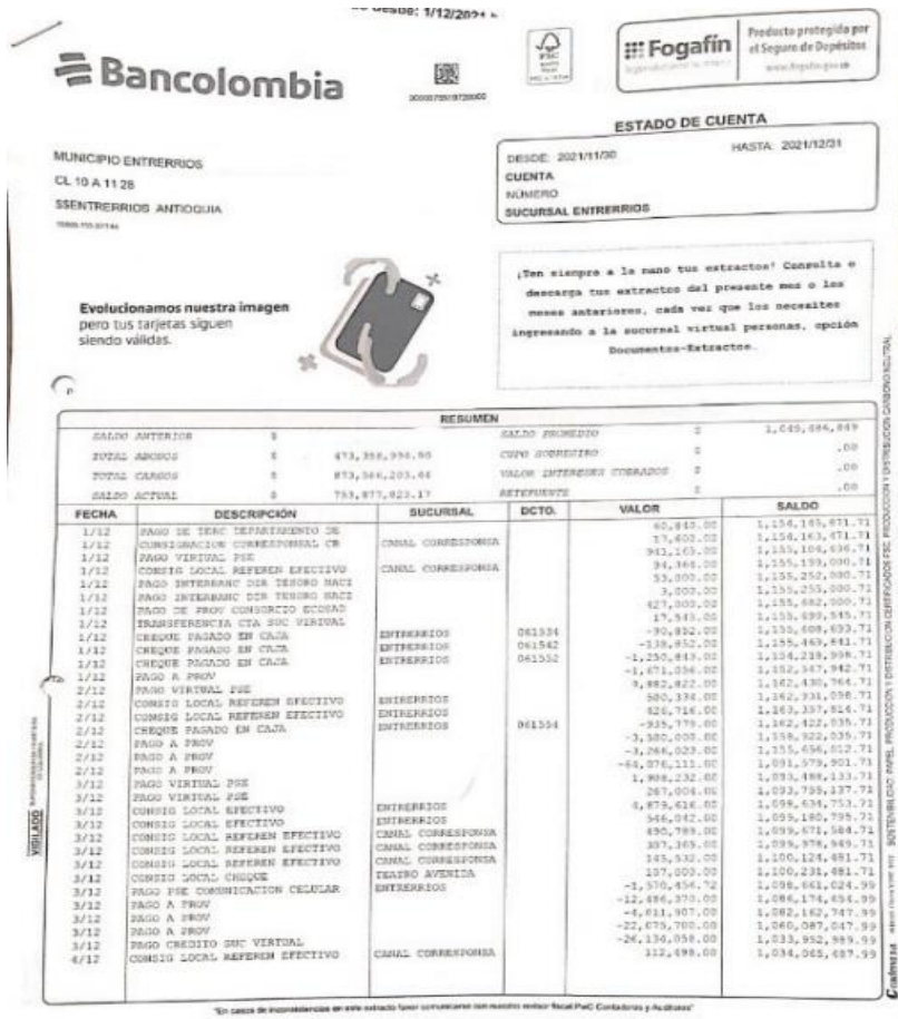
Ilustración 3 Extracto Bancario