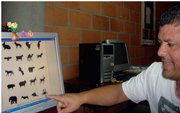
Ejercicios de conciencia fonológica y discriminación visual, estudiante con dificultades auditivas. Foto tomada por Luisa Fernanda Ríos, octubre de 2012.