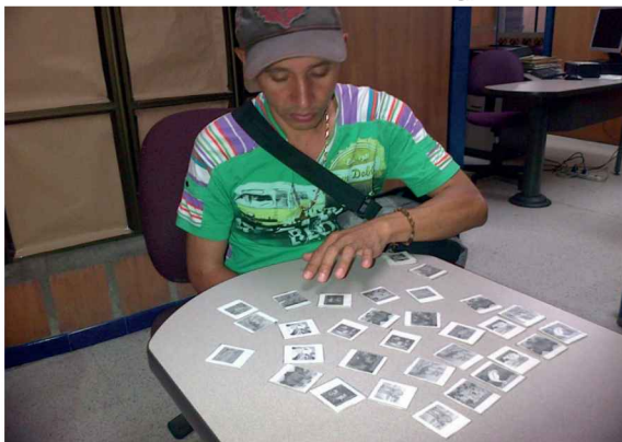
Imagen 6. Ejercicios de denominación visual de imágenes

Estudiante de primer grado en atención individual para estimulación cognitiva, ejercicios de denominación visual de imágenes. Foto tomada por Luisa Fernanda Ríos, mayo 2013.