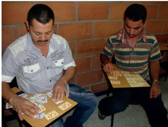
Imagen 4. Clase de lecto-escritura

Estudiantes de segundo grado con necesidades educativas (trastorno mixto del aprendizaje) especiales, en clase de lecto-escritura: unión de sílabas para formar palabras monosílabas. Foto tomada por Luisa Fernanda Ríos, julio de 2011.