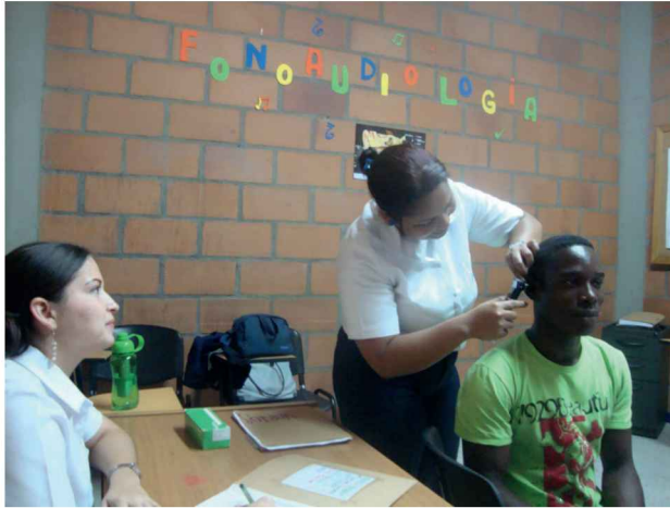
Imagen 2. Valoración fonoaudiología

Estudiante con necesidades educativas especiales en valoración de fonoaudiología.