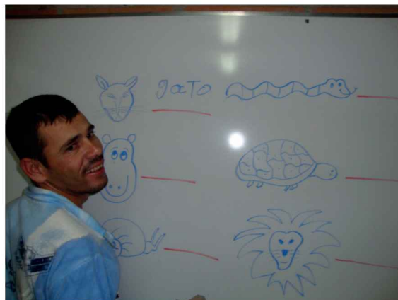
Imagen 1. Estudiante de primer grado.

Estudiante de primer grado; su proceso lector avanza significativamente, pero su proceso escrito muy poco; ya presenta digrafía (trastorno de la escritura).